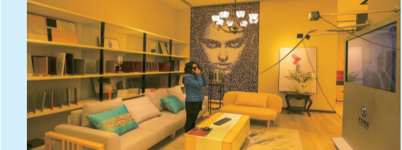
市民在梁平天棠家居体验馆内体验天棠家居VR设计演示