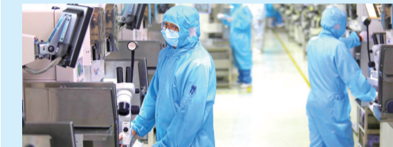
重庆平伟实业股份有限公司无尘生产车间，工人通过电子显示屏观察芯片的生产情况