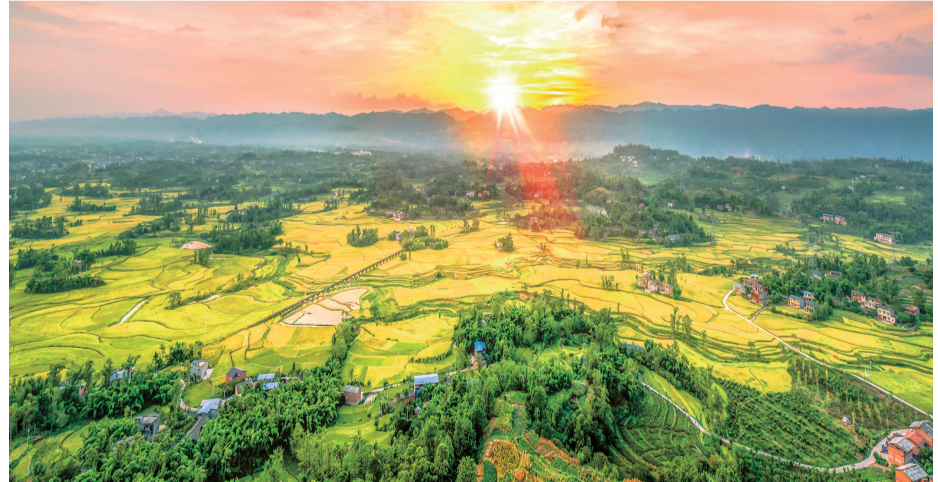
巴渝第一大平坝——梁平坝子

2022年全区地区生产总值577.2亿元，增长4.2%，人均地区生产总值达89760元，固定资产投资增长12.8%，社会消费品零售总额增长1.9%，一般公共预算收入增长10.8%。