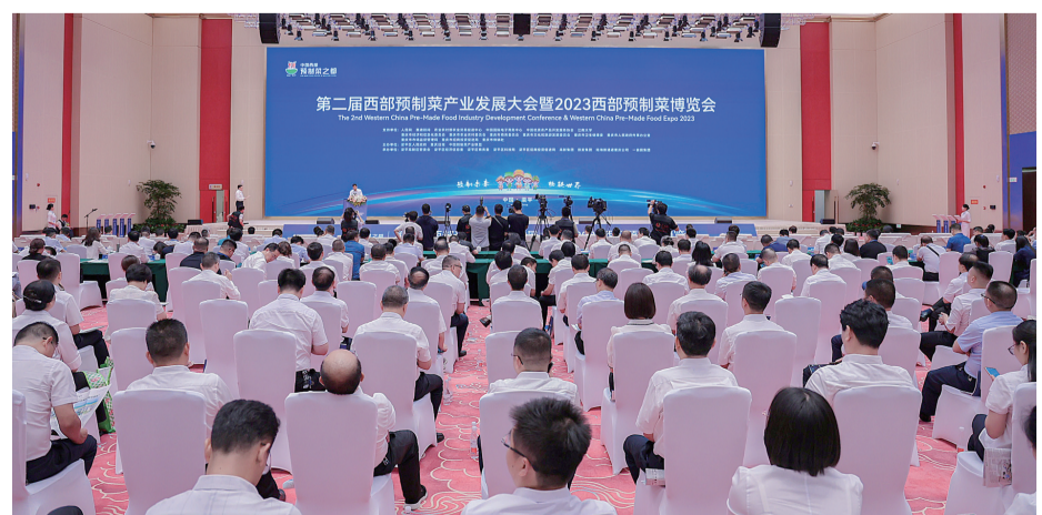
第二届西部预制菜产业发展大会暨2023西部预制菜博览会