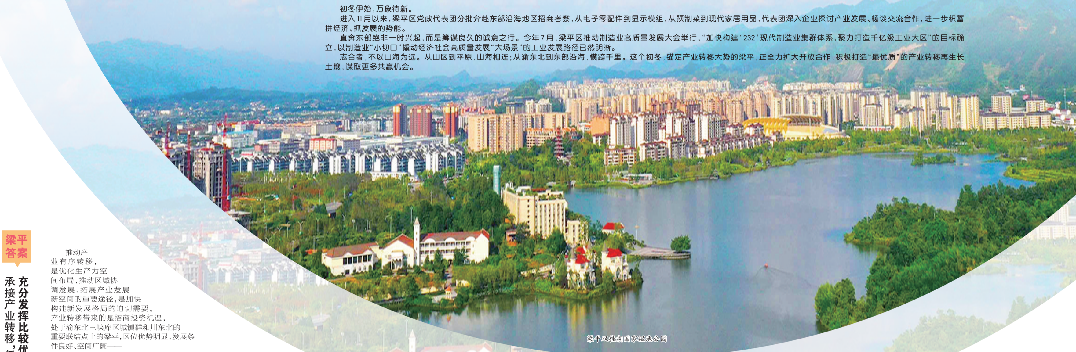
梁平双桂湖国家湿地公园