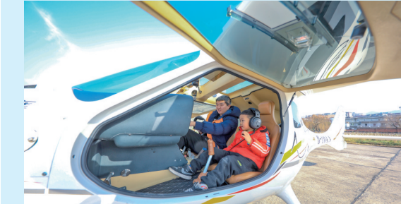
梁平已开展飞行培训，空中观光等通用航空业务