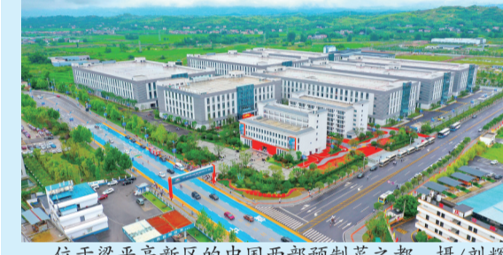
位于梁平高新区的中国西部预制菜之都