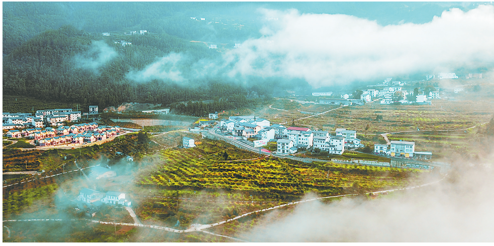
巫溪红池坝镇茶山村新貌。

（本文执笔：朱涛；调研组成员：重庆理工大学管理学院教授、博导张凤太，重庆理工大学马克思主义学院教师李超；重庆日报记者侯金亮、朱涛）