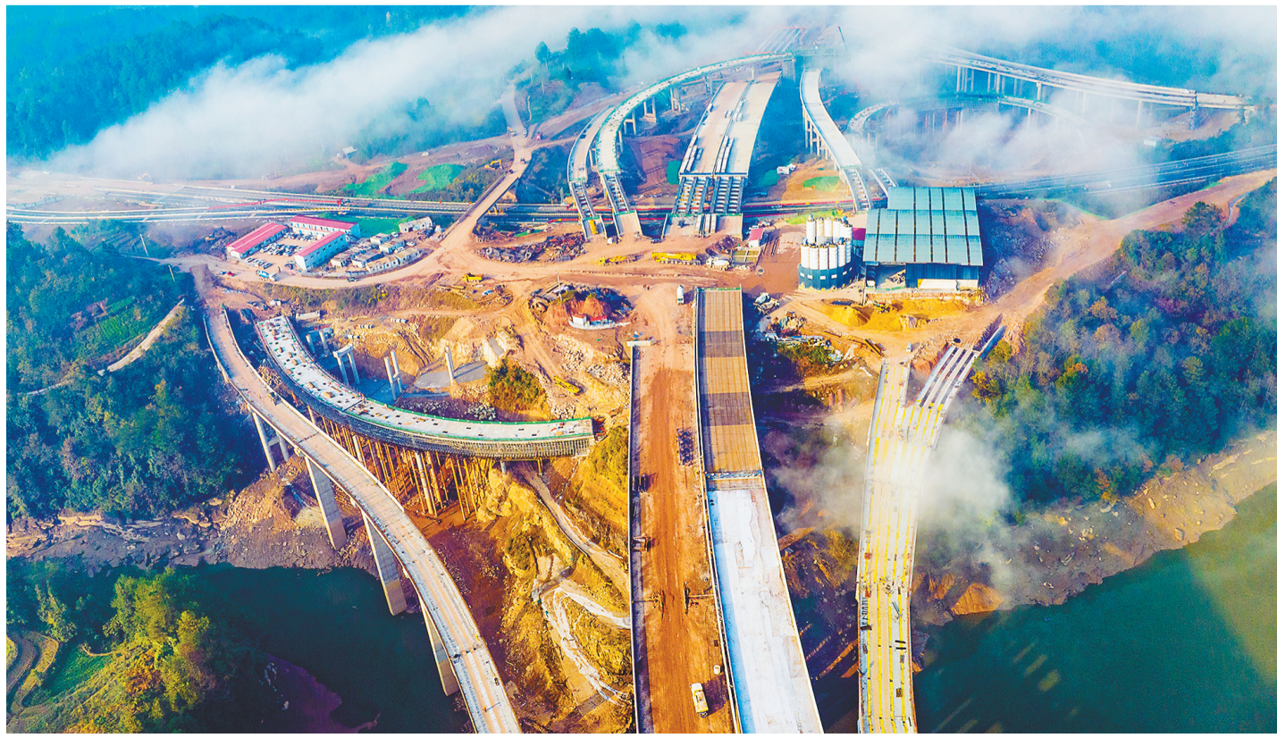
11月19日,南川区河图镇,渝湘复线高速公路河图枢纽互通项目的建设者正抓紧施工抢进度。