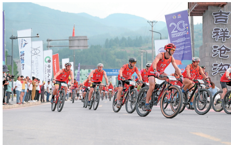
2023第18届中国国际山地户外运动公开赛第四赛段在沧沟出发

春天赏花，夏天吃瓜，秋天摘果，冬天吃羊肉……如今的沧沟乡，农村人居环境持续优化，村庄更加美丽宜居，群众幸福指数不断提高。