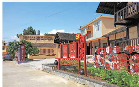
美丽宜居的沙台铺