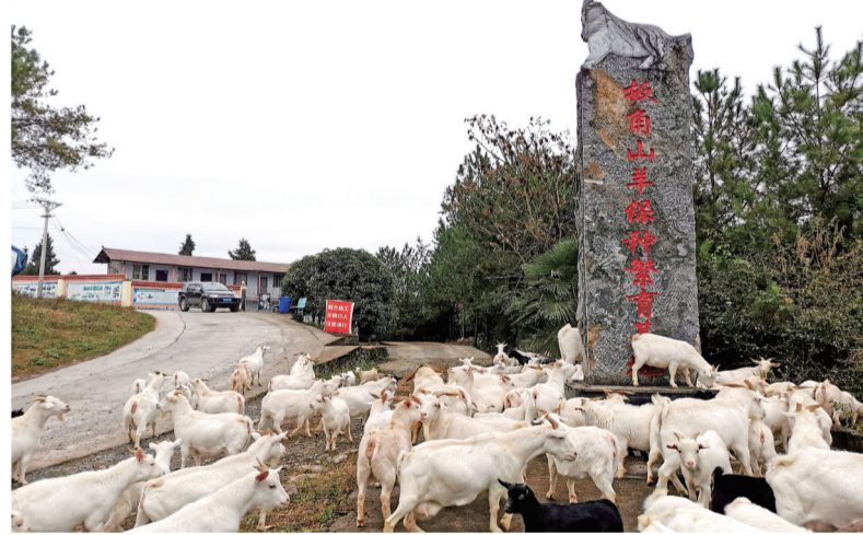
板角山羊保种繁育基地