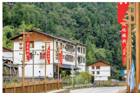
人居环境整治后的沧沟乡

接下来，沧沟乡将持续推进美丽宜居示范乡镇建设，紧抓“一深化三提升”，在不断完善场镇基础设施建设的同时，大力开展人居环境整治，提升场镇风貌，努力将沧沟打造成为区域示范和建设样板，让沧沟乡水清、屋美，道路整洁宽敞。