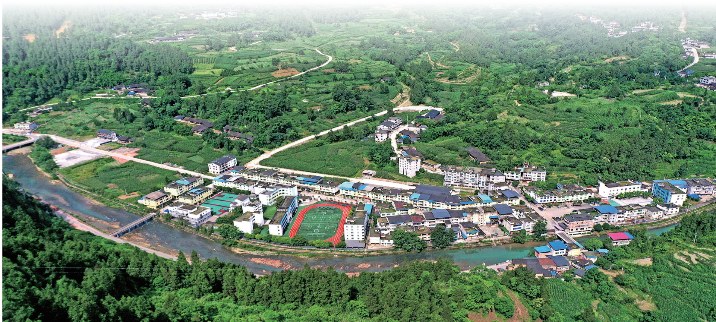
依山傍水的沧沟乡