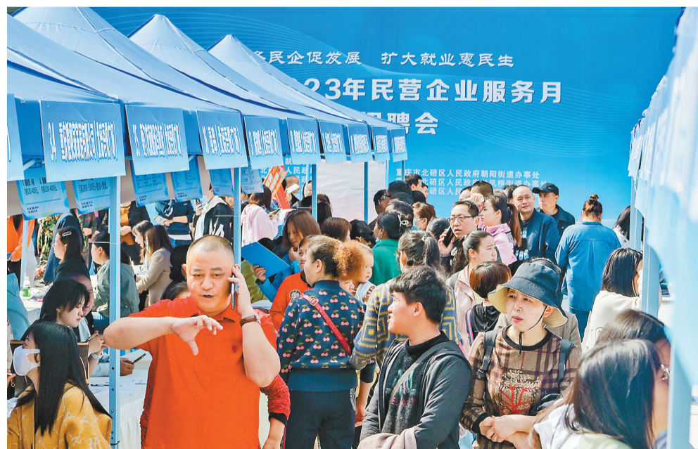
北碚区2023年民营企业服务月专场招聘会现场，求职者驻足浏览企业和岗位信息。

今天，全国有超过4亿人在民营经济市场主体中就业，大部分家庭财富来自其中。所有民营企业、个体户背后的财富与权益，就是千千万万家庭和个人的财富与权益。因此，善待民营企业，就是善待我们自己；保护民营