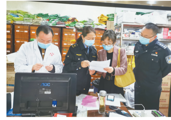
黔江区市场监督管理局、卫健委、公安局联合开展麻醉药品和精神药品专项检查