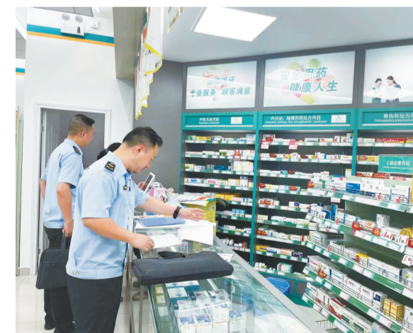
市市场监管综合行政执法总队执法人员在对药房进行检查

业、民营医院、个体诊所和互联网诊疗医疗机构开展跨区县交叉协同检查,更加真实掌握基层药品安全现状。不断完善药品、医疗器械跨区域委托生产协同监管机制,开展受托生产方跨省延伸现场检查38家次。强化疫苗储运管理,派遣检查组对全市重点疫苗配送企业的市外仓储物流及干线运输创新开展随行检查。从严加强网络销售监管,启用药品网络销售报告系统,规范药品网络销售备案管理和报告,携手国家药监局南方所监测网络违法信息24条,开展药品网络销售、上下游流向核实等联合检查50余次。