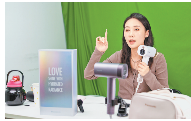
十一月十日,渝北区重庆毛毛虫电子商务有限公司直播直播间,主播在直播带货。

重庆中良美电子商务有限公司(简称重庆中良美)在“双11”期间,动用10个直播间,50多名主播为自由点、冷酸灵、友友、老四川、陈昌银等品牌提供电商服务,每天直播间的商品交易额在100万元左右,人流量是平常的