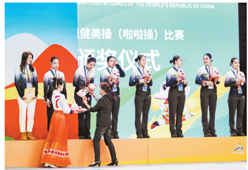
重庆市第二十九中学校 Sparkle 啦啦操队队员在颁奖仪式上。