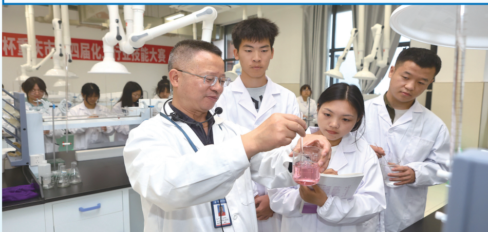
教师带领学生做化学实验