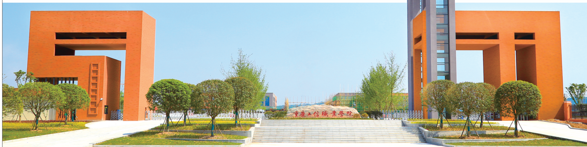
工信职业学院长寿校区大门

苦干实干开新局,攻坚克难育新人。在这条谋变破局的崛起之路上,重庆工信职业学院坚守“工于匠心,信于立德”的教育情怀,坚定“立德修身、潜心治学,做学生成长成才的引路人”的职业信念,走出一条立足重庆、辐射西南、走向全国、具有鲜明特色品牌的新工科高职教育发展之路,为重庆的工业信息化发展提供强有力的的高素质技术技能人才支撑,为经济社会发展贡献“工信力量”。