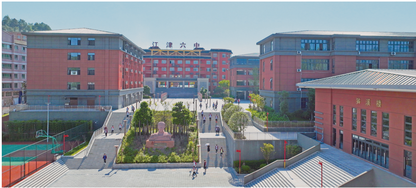
江津六中扩建校区

江津区坚持把立德树人贯穿教育教学全过程，着力打造全方位、立体式的育人时空，引导学校挖掘自身优势，走好特色化发展之路，形成百花齐放的多元教育格局与教育生态。