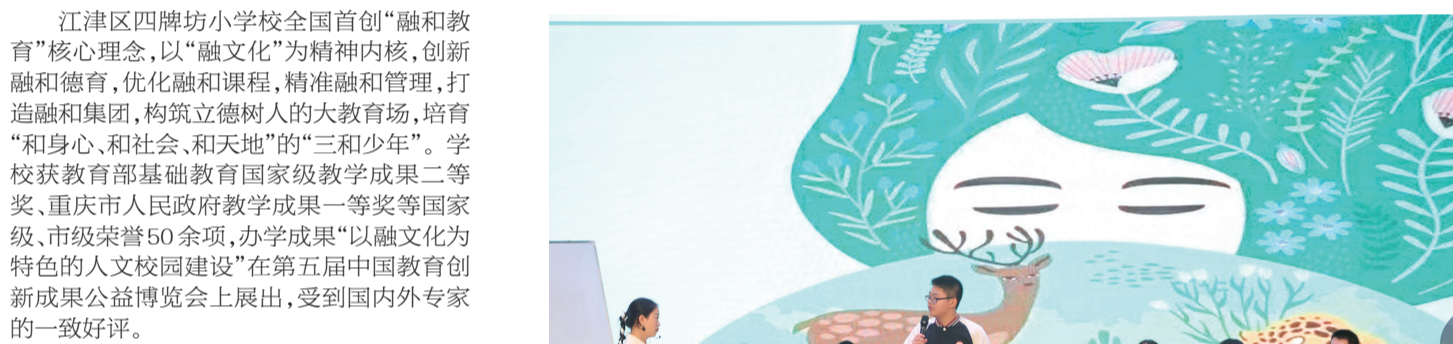
江津区举办教学改进项目暨课例展示活动