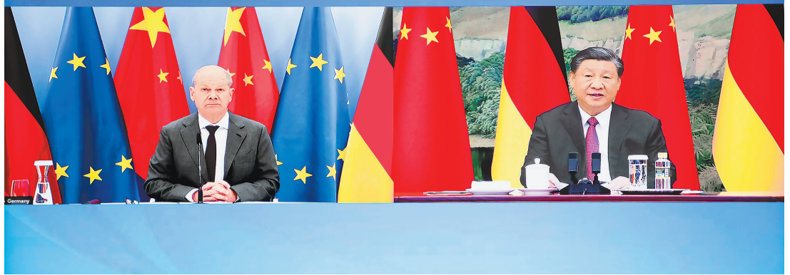
11月3日下午,国家主席习近平同德国总理朔尔茨举行视频会晤。