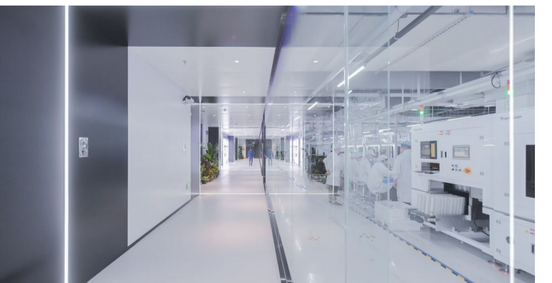
重庆传音科技有限公司生产车间

传音控股旗下的重庆传音科技有限公司（以下简称“传音公司”）于2017年落户渝北，是渝北区深入推进实施“满天星”行动计划重点培育的“北斗星”企业，也是上述负责人口中的“龙头”。