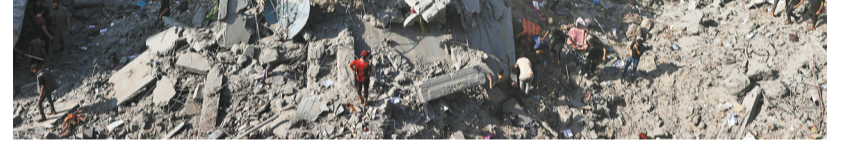
11月2日，在加沙地带中部的布赖杰难民营，人们在以色列空袭后展开营救工作。巴勒斯坦官方通讯社“瓦法”11月2日报道说，以色列军队当天空袭位于加沙地带中部的布赖杰难民营，造成至少15人死亡。

美国白宫1日表示，如果将来在巴勒斯坦加沙地带实施维持和平行动，美国不会派军队参与。同一天，两名美国参议员证实，美国及其伙伴正在考虑，加沙战事结束后向加沙地带部署一支多国维和部队。