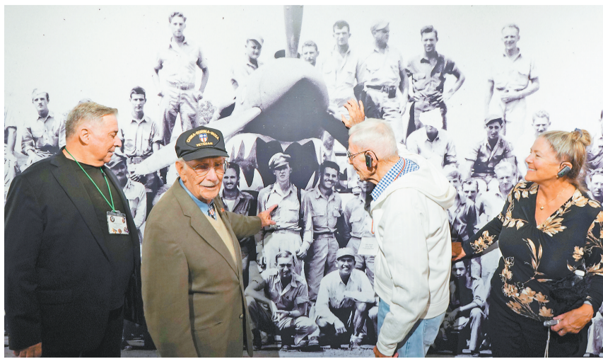
11月1日，重庆史迪威博物馆，美中航空遗产基金会主席杰弗里·格林（左一）和飞虎队老兵哈里·莫耶（右二）、梅尔文·麦克马伦（左二），及飞虎队老兵后代罗宾·奥尔尼（右一）正在看美国飞虎队部分队员合影。

“飞虎队精神永不消逝，中美友谊永不消逝。”11月1日，美中航空遗产基金会主席杰弗里·格林和飞虎队老兵哈里·莫耶、梅尔文·麦克马伦一行来到重庆史迪威博物馆，在一张张老照片、一件件老物件前流连，饱含深情地回忆起同中国人民并肩抗战的岁月。 当天下午6点，莫耶和麦克马伦走进重庆史迪威博物馆大门，做的第一件事就是共同为史迪威将军头像敬献花篮。尽管莫耶已有103岁，麦克马伦也有98岁，但他们依然精神矍铄。 随后，他们参观了史迪威将军故居、史迪威将军生平图片展、第二次世界大战时期美国援华空军图片实物展，一边仔细聆听讲解，一边与身边的亲友交谈，并认真地在“友谊墙”上签下自己的名字，欣喜地合影留念。