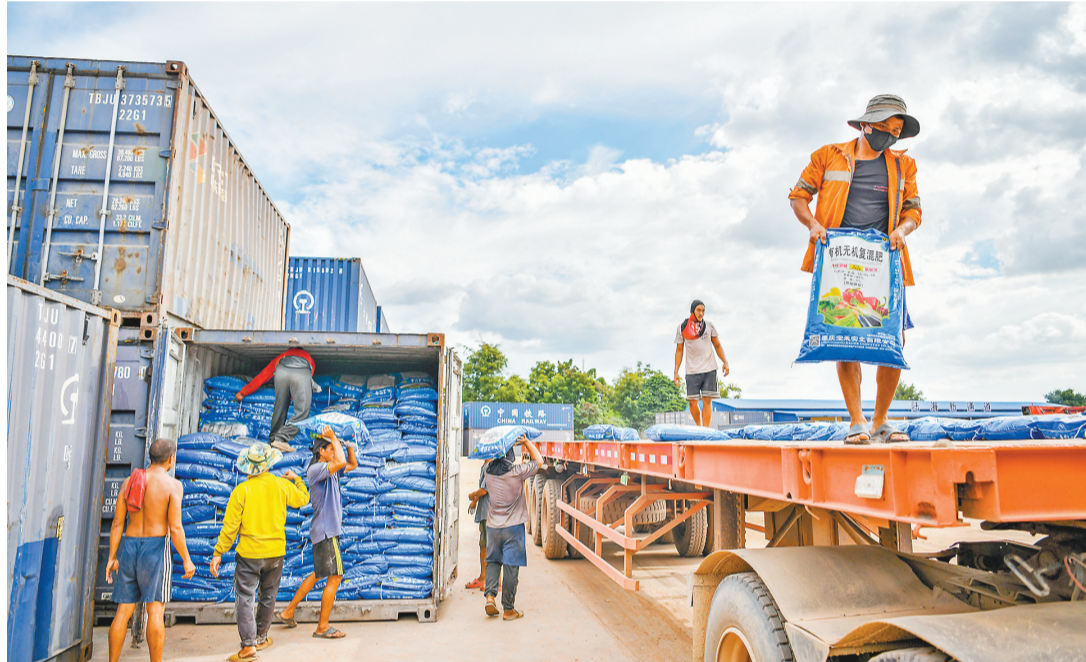
十月二十四日，陆海新通道老挝万象集散中心，工人正在搬运货物。