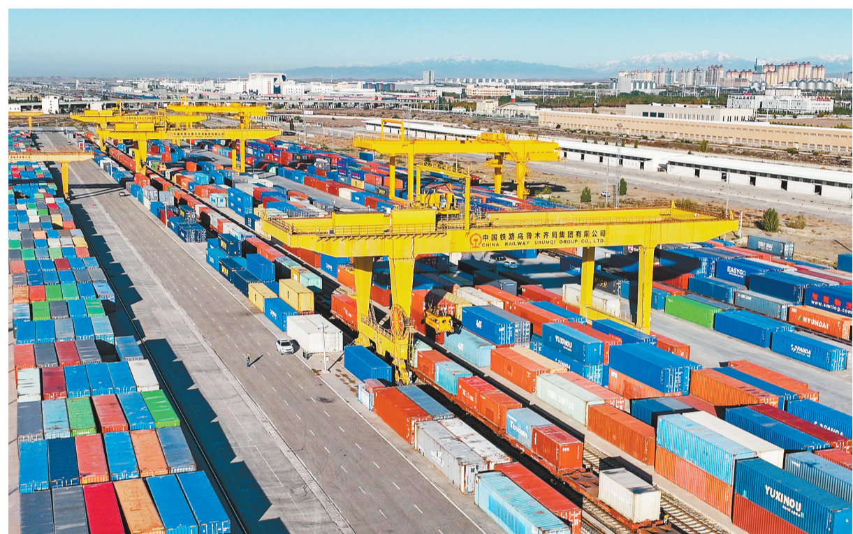
10月18日,新疆霍尔果斯铁路口岸换装场,龙门吊正在繁忙作业。

2023年1月—9月30日,通过西部陆 海新通道从新疆发出的货物为152标箱, 货值达2118万元