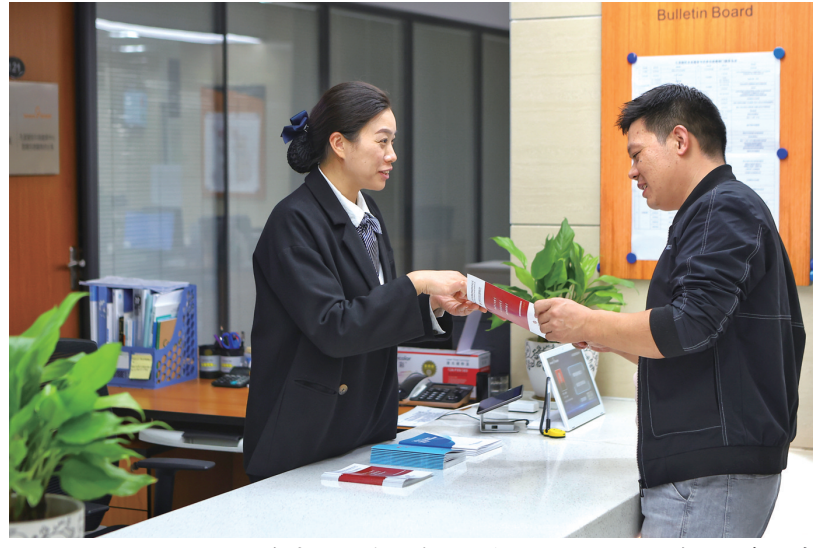
企业服务窗口工作人员为民营企业提供咨询服务

为解决企业实际困难，全局还广泛开展大走访大调研。今年前三季度已收集企业困难诉求673条，办理回复率达100%。