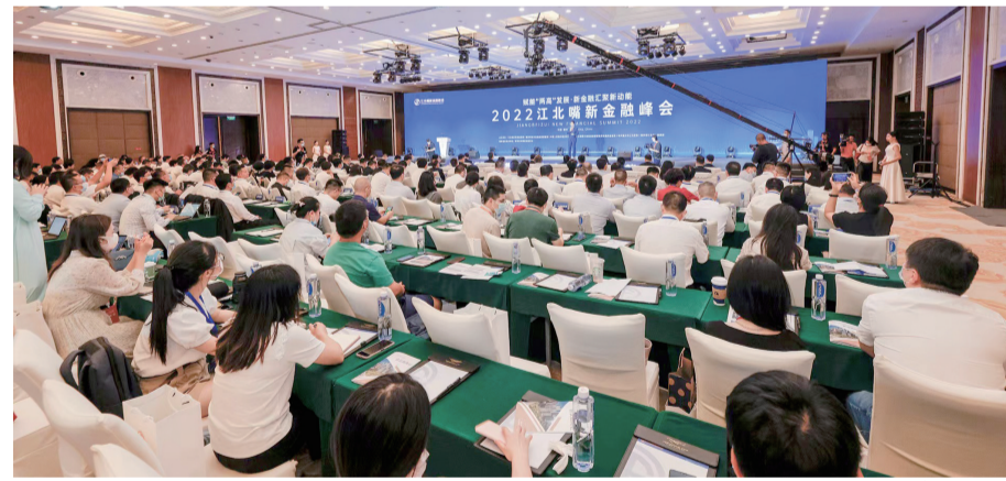
2022江北嘴新金融峰会开幕式现场