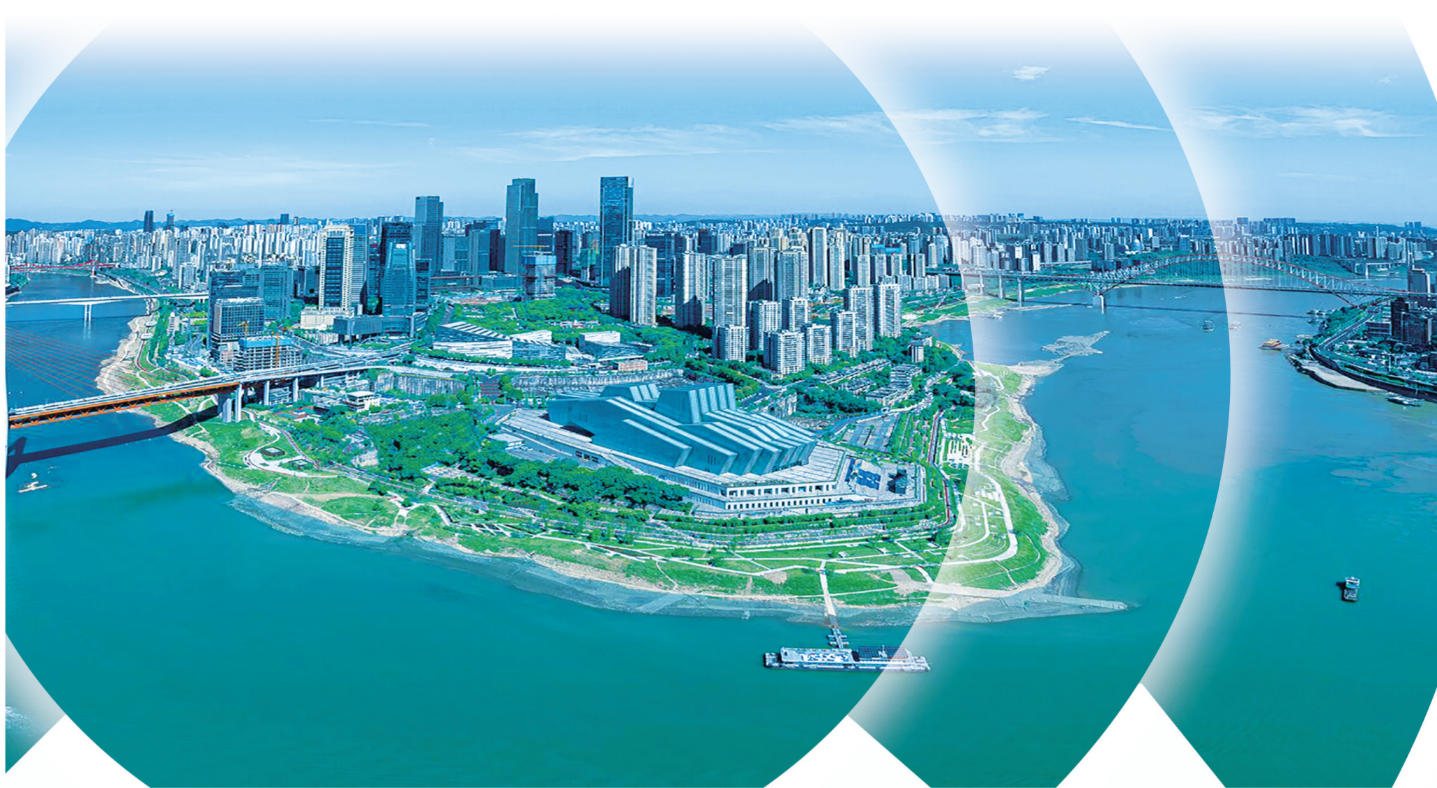
今日江北嘴

10月23日至24日，第四届江北嘴新金融峰会在江北嘴举行。本次峰会将围绕“新征程、新使命、新金融：加快建设西部金融中心”这一主题进行研讨，为重庆加快建设西部金融中心注入“新”动能、提供“新”支撑。