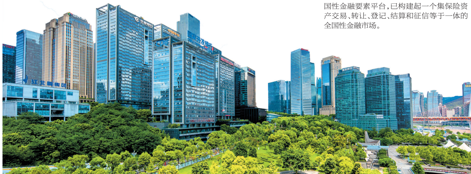
江北嘴中央商务区

这些要素市场中，不乏重量级的。如，中信银行国际业务运营中心是一家总行级的国际业务运营中心，年国际单证结算量超过500亿美元；中保登作为继上海保险交易所之后全国的第二个保险交易所、重庆首家全国性金融要素平台，已构建起一个集保险资产交易、转让、登记、结算和征信等于一体的全国性金融市场。