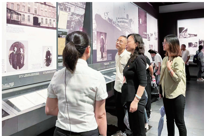
江北区财政局机关党支部开展“追寻伟人足迹、传承红色基因”主题党日活动