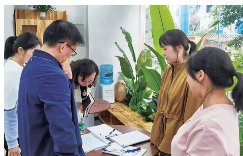
江北区财政局干部到联系点桥北社区开展走访调研

财政干部队伍建设,持续提高干部职工的政治领悟能力、统筹协调能力和财政财务管理能力、改革创新能力和廉洁自律能力。