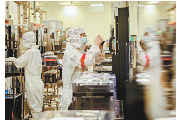
▲华润微电子（重庆）有限公司，技术员在生产线上忙碌。

国家金融监督管理总局重庆监管局数据显示，2023年上半年，其辖内银行业保险业给予共建成渝地区双城经济圈2023年重大项目授信金额达7673.73亿元，实现贷款投放659.15亿元，提供风险保障473.70亿元，为两地合力共建基础设施网络、现代产业体系、科技创新中心、巴蜀文化旅游走廊等提供投融资支持和风险保障，助力西部金融中心建设再上新台阶。