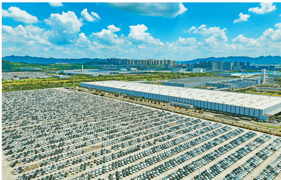
▲两江新区龙盛新城的长安汽车工厂刚出厂的新能源汽车。

报告，成渝中线高铁成为沪渝蓉高速铁路的重要组成部分，不仅将重庆、成都“双核”通勤时间压缩至1小时内，还将打通双城经济圈东出方向的高速客运通道。