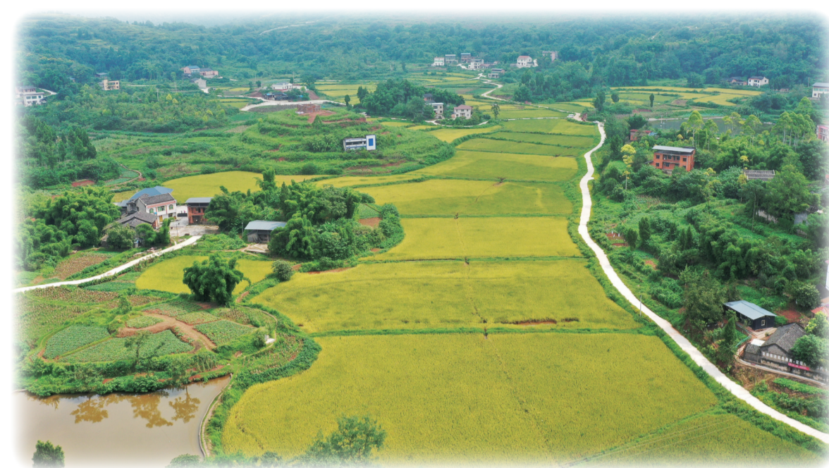
兴业银行重庆分行支持铜梁区首个流域治理与乡村振兴EOD项目