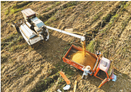
潼南农机团队,假期跨区域作业。

同样,在金融城市中心二期二标段项目建设现场,施工人员在各自的岗位上作业,现场忙碌而有序。