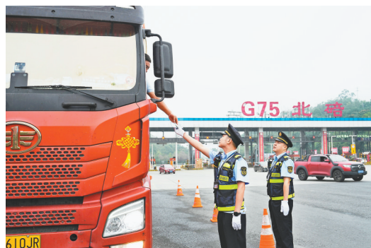
10月1日,兰海高速北碚区收费站,交通执法人员对过往车辆进行抽检。

“目前,项目一期主体结构已全面完工,正进入室内装修阶段。”高新区人才社区一期项目现场负责人说。