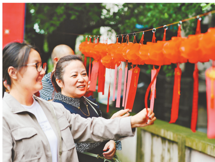
▲9月27日，万盛举办迎中秋国庆活动，市民正在猜灯谜。

值得一提的是，在本届都市艺术节开幕式上，重庆国泰艺术中心还发布了其十周年数字文化衍生品，并挂牌成立了重庆国际舞蹈艺术中心。