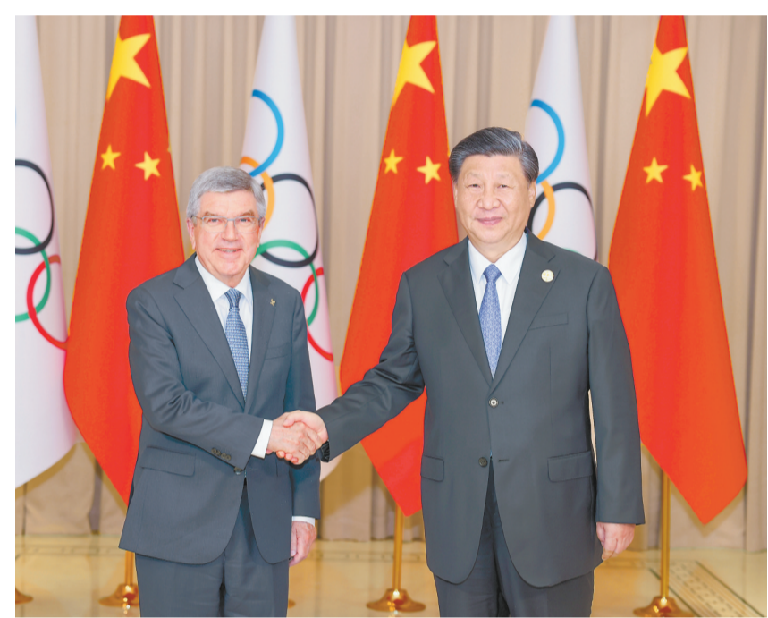
9月22日下午，国家主席习近平在杭州西湖国宾馆会见来华出席第19届亚洲运动会开幕式的国际奥林匹克委员会主席巴赫。

育事业，积极参与国际奥林匹克事务，践行“更快、更高、更强——更团结”的奥林匹克格言。去年中国克服新冠疫情等挑战，向世界奉献了一届“简约、安全、精彩”的北京冬奥会，北京成为全球首个“双奥之城”。中国传播奥林匹克精神的脚步永不停歇，愿同国际奥委会一道，坚持体育非政治化原则，充分利用北京冬奥会遗产，为推进奥林匹克事业和构建人类命运共同体作出新的更大贡献。目前，杭州亚运会的筹备工作已经就绪。中国政府和中国人民完全有信心呈现一届“中国特色、亚洲风采、精彩纷呈”的体育盛会，为推动奥林匹克运动发展、促进亚洲人民团结和友谊作出新的贡献。