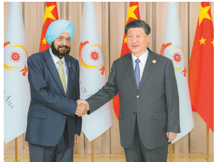
9月22日下午，国家主席习近平在杭州西湖国宾馆会见来华出席第19届亚洲运动会开幕式的亚洲奥林匹克理事会代理主席辛格。