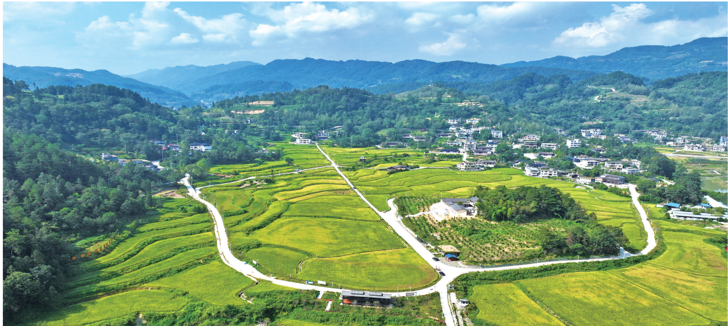
黔江区太极镇李子村金鸡坝农业观光体验园把民居、河流、公路、山峦掩映成画卷