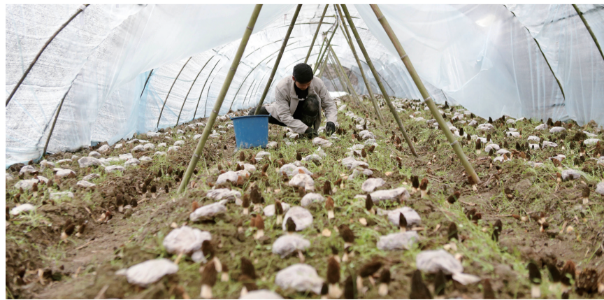
村民在黔江区鹅池镇方家村羊肚菌种植基地采摘羊肚菌