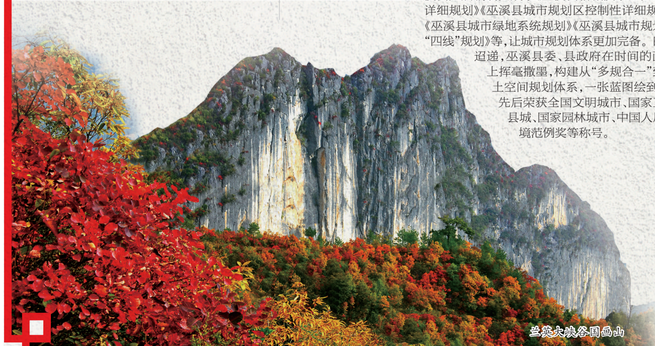
巫溪大峡谷国高山

巫溪县第十四次党代会提出，咬定“到2035年实现绿色崛起、基本实现社会主义现代化”总目标，打造特色宜居城市“巫溪样板”。做好做细城市规划，不仅是对人民负责，更是对历史负责。巫溪县委、县政府顺应城市发展新理念新趋势，沿着脚下方向一届接着一届干，精美的巫溪县城在三峡腹地优雅绽放、向美生长。