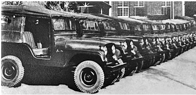
▲20世纪50年代，长安厂生产的吉普车。 ▲20世纪三四十年代的三峡染织工厂