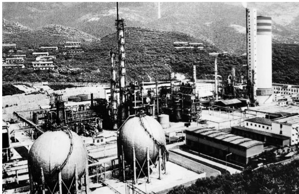
▲三线建设时期筹建的851厂大化肥装置。