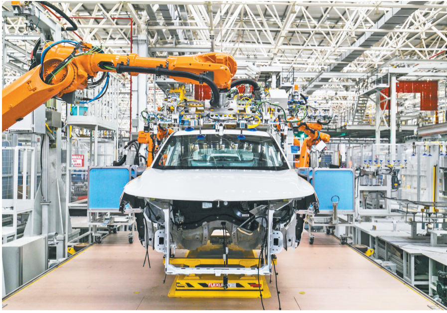
赛力斯智慧工厂。

根据规划,2027年该区智能网联汽车产业产值将达500亿元,助推我市建设万亿元世界级智能网联新能源汽车产业集群目标。