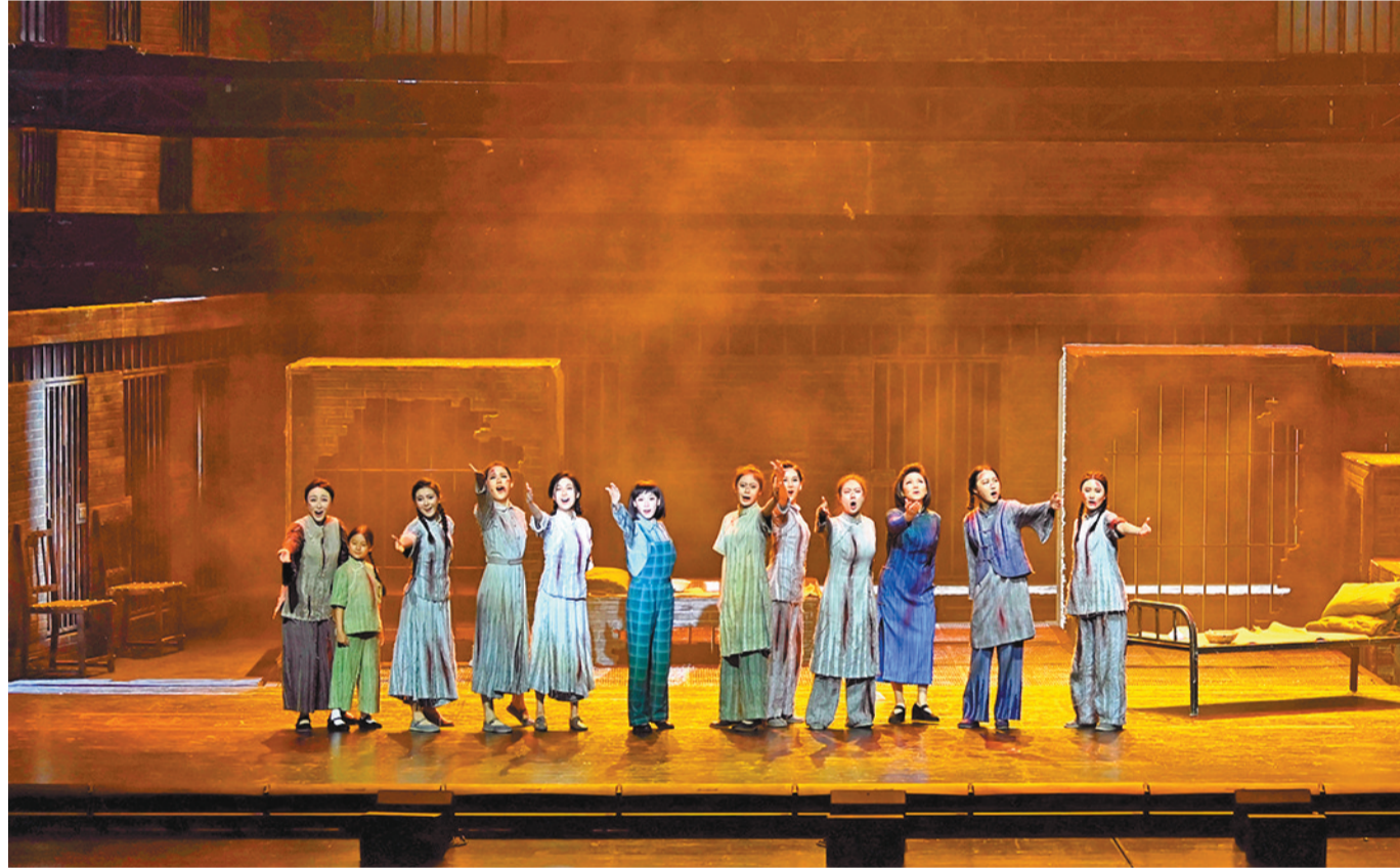
9月14日,重庆大剧院,原创音乐剧《江姐》首演。