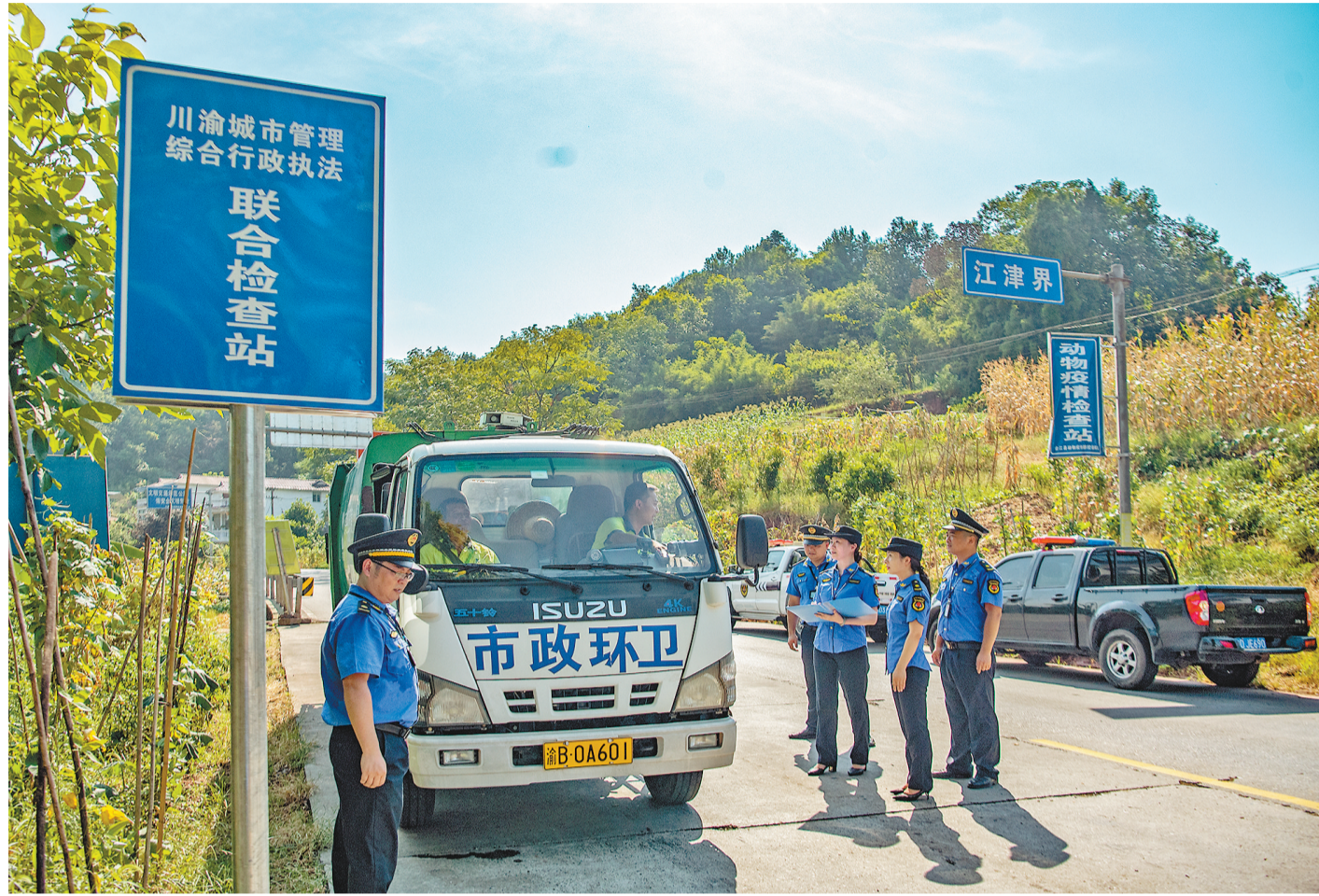
▲地处川渝交界处的重庆市江津区塘河镇和四川省泸州市合江县白鹿镇，两地开展城市管理综合执法。(资料图片) 记者 郑宇 李志峰 摄/视觉重庆