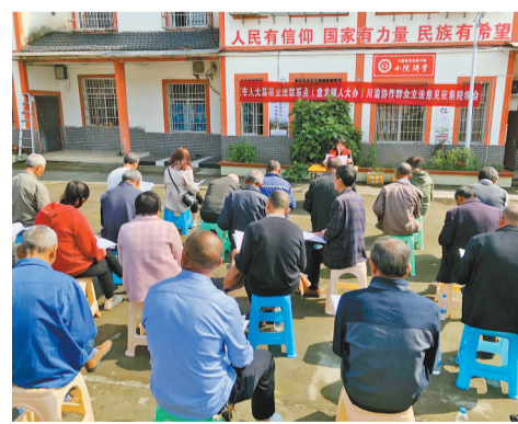
开展立法意见征集座谈会。

荣昌区人大常委会有关负责人表示，盘龙基层立法联系点立足区位优势，通过基层人大视角、整合毗邻地区资源，开展“小切口”立法建议收集和调研，助力区域协同立法，是成渝地区双城经济圈建设走深走实的一个生动缩影。