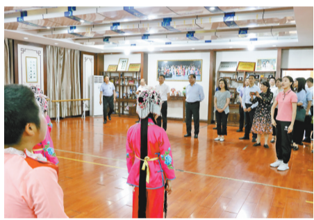
▲重庆市人大常委会开展川剧保护协同立法调研。