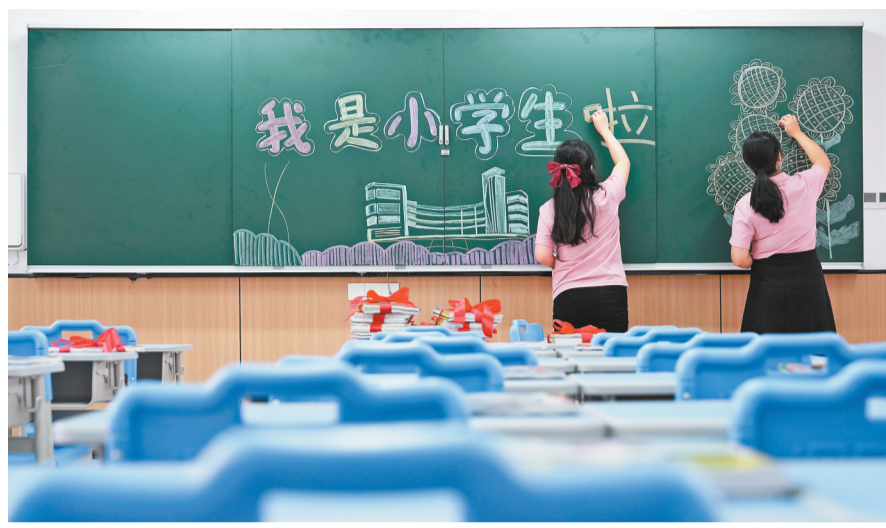
8月27日,北碚区两江春晖小学,两名教师在绘制“开学黑板报”。