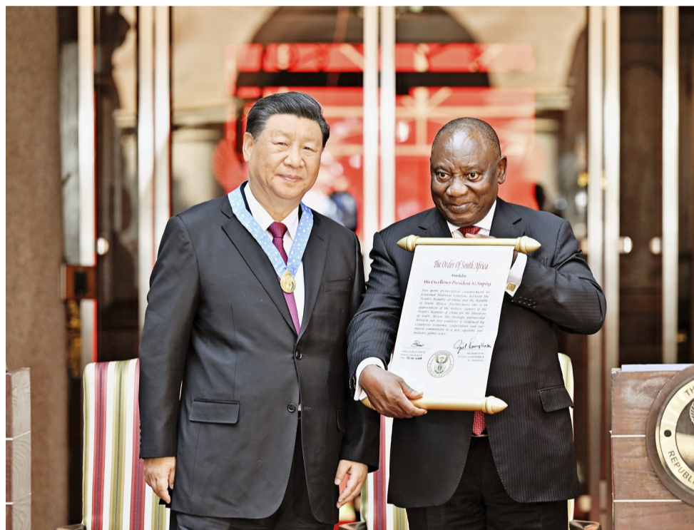
当地时间8月22日上午,正在南非进行国事访问的国家主席习近平在比勒陀利亚总统府同南非总统拉马福萨会谈。会谈后,拉马福萨向习近平授予“南非勋章”,这是南非授予重要友好国家元首的最高级别勋章和最高荣誉。