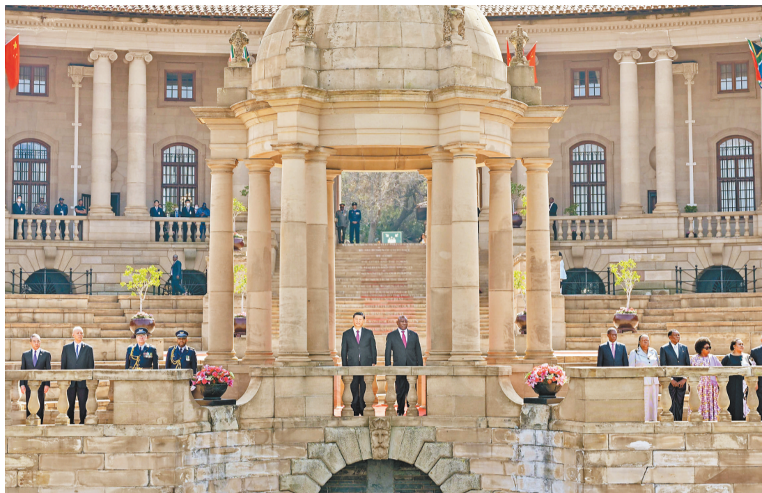
当地时间8月22日上午,正在南非进行国事访问的国家主席习近平在比勒陀利亚总统府同南非总统拉马福萨会谈。会谈前,拉马福萨在总统府广场为习近平举行欢迎仪式。