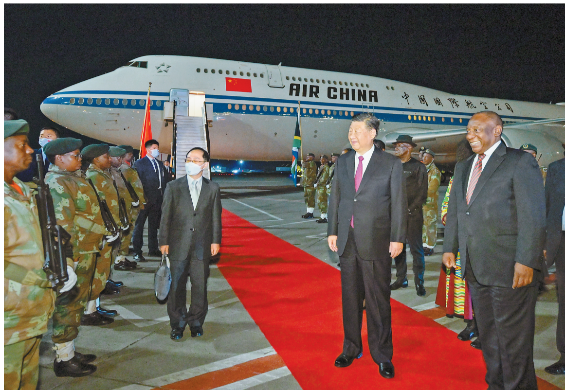
当地时间八月二十一日晚,国家主席习近平抵达约翰内斯堡,出席金砖国家领导人第十五次会晤并对南非进行国事访问。这是习近平在机场受到南非总统拉马福萨等热情迎接。