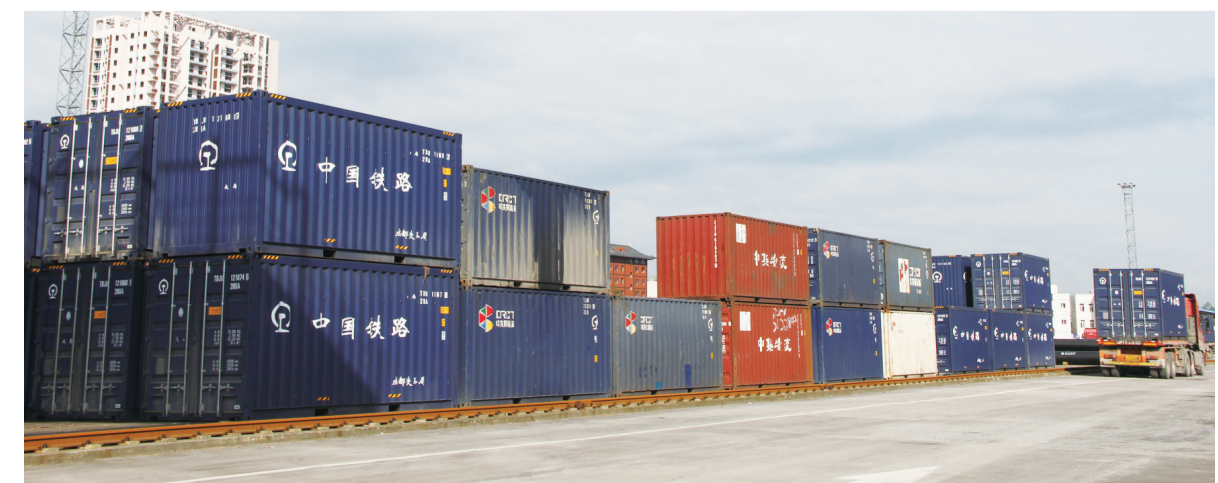
铁路集装箱站满负荷运转