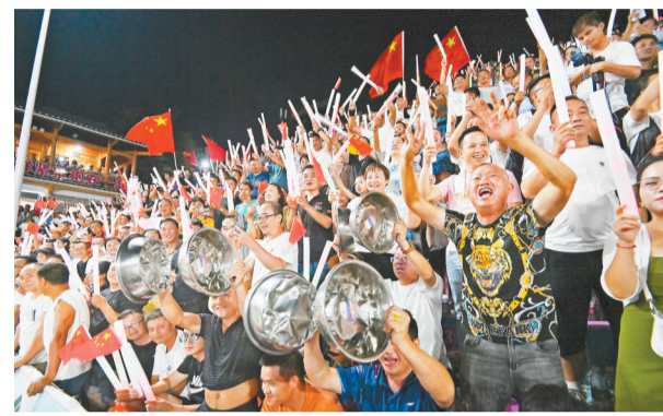
▲8月20日，贵州台江县台盘村，全国“村BA”西南大区赛决赛现场，村民、游客为球员加油。