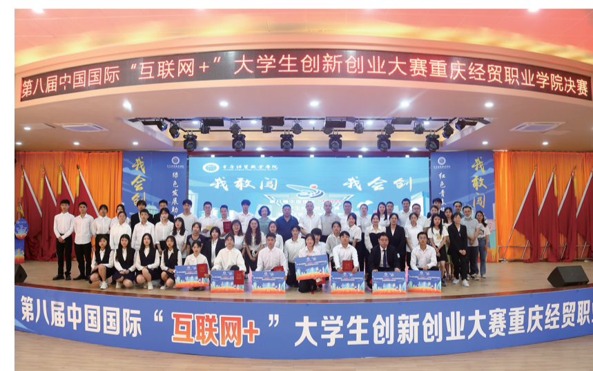
重庆经贸职业学院创新创业大赛

“黔江有基础，更有潜力。”据黔江区人社局相关负责人介绍，如今职业教育已成为黔江的一面旗帜，截至目前，全区共有2所高职、1所中职，并打造了国家级高技能人才培训基地、市级公共实训基地、市级技能大师工作室、市级职业技能等级评价三方机