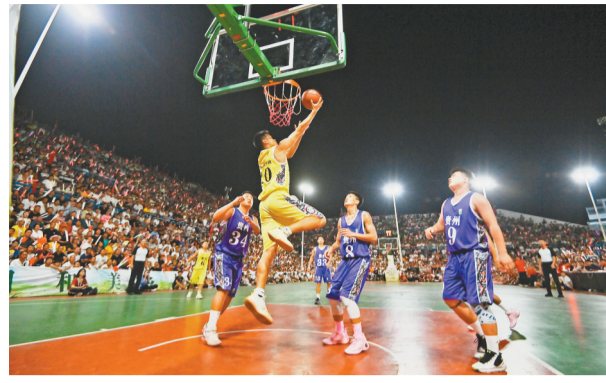
▲8月20日，贵州台江县台盘村，全国“村BA”西南大区赛决赛现场，重庆球员正在上篮。