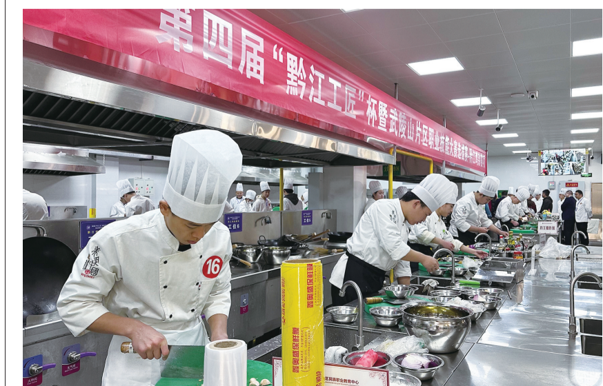
第四届“黔江工匠”杯职业技能大赛现场

如今以职业人才链的“强”，激发产业链的“活”，托举城乡发展链的“优”，这里潜力更大、动力更强、活力更足。龙搏 刘茂娇 图片由黔江区人社局提供