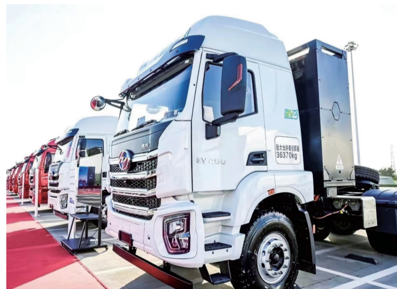
中信银行重庆分行依托“信e链”产品,向国内重卡汽车行业某龙头企业提供金融服务

该企业为“重庆市智能工厂”——重庆某上市公司的产业链供应商。由于规模小且自有资金有限,资金的流动性一直是企业的“老大难”。中信银行重庆分行在了解到该企业的融资需求后,经与