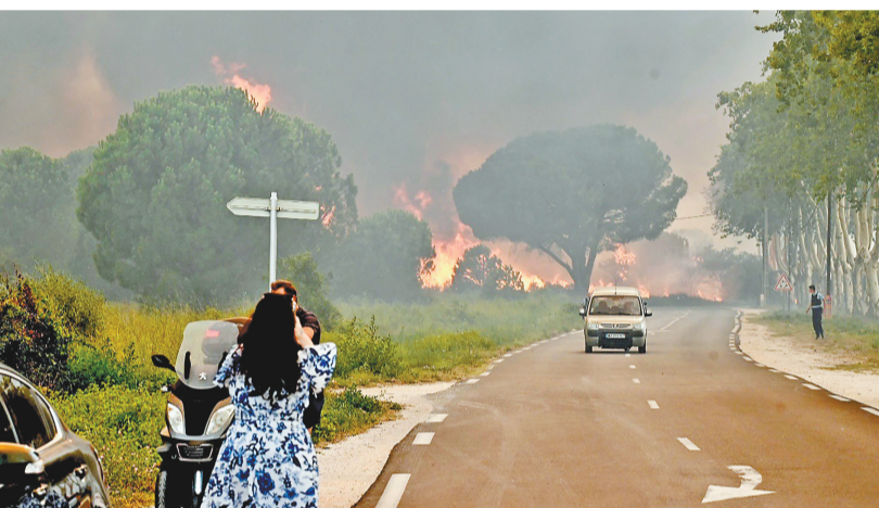
据法国媒体报道,该国南部东比利牛斯省8月14日下午发生森林火灾,过火面积约500公顷,包括游客在内3000多人被疏散。图为一名女子在法国东比利牛斯省圣安德烈拍摄火灾照片。