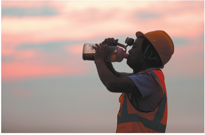
▲8月5日傍晚,渝遂复线高速小安溪特大桥施工现场,工人正在补充水分。