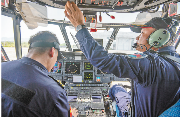
▲8月11日,渝北区龙兴航空应急救援基地,机组人员正在进行起飞前的准备工作。