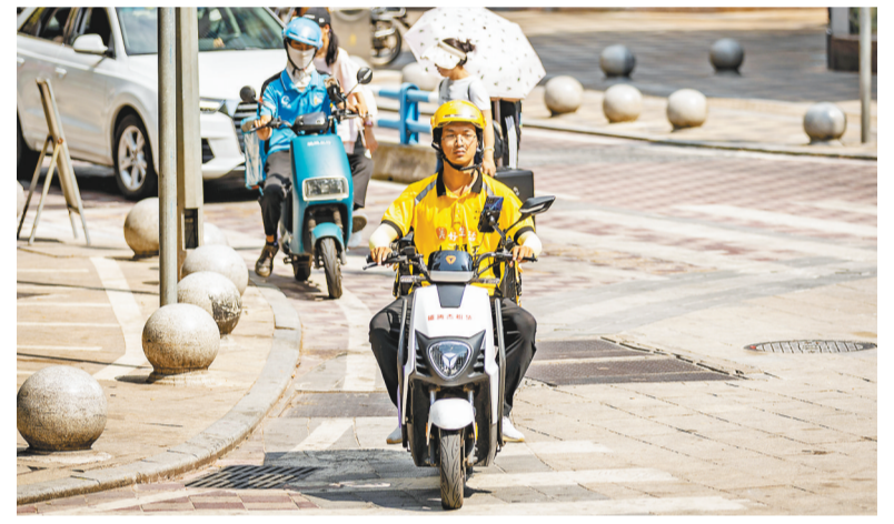
▲8月11日,九龙坡区杨家坪,外卖小哥在烈日下送餐。