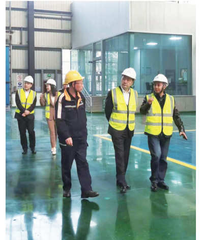
开展大走访大调研活动