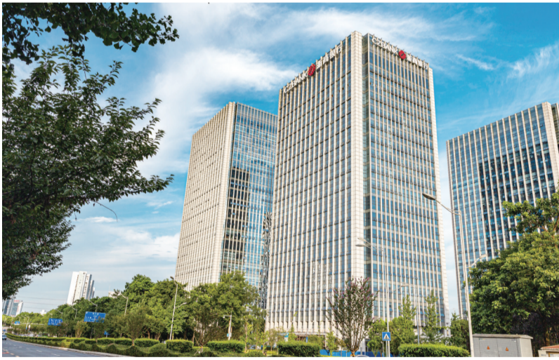
浙商银行重庆分行大厦

为进一步推动自身发展融入地方发展大局，浙商银行重庆分行党委扎实开展“大走访大调研精准对标精准施策”专项活动，主动拜访两江新区、江北、渝北、沙坪坝等20多个地方党委政府及市级职能部门，走访人行重庆营管部、国家金融监督管理总局重庆监管局、市金融监管局等部门及派出机构9个，形成调研课题报告5篇，对调研中发现的、群众急难愁盼的15个问题纳入清单，确保件件有着落、事事见成效，促进调查研究成果的深化、内化和转化。