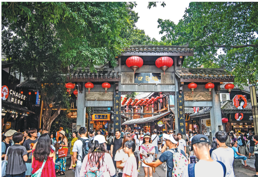
7月20日，磁器口古镇大门处，众多游客在此游玩。