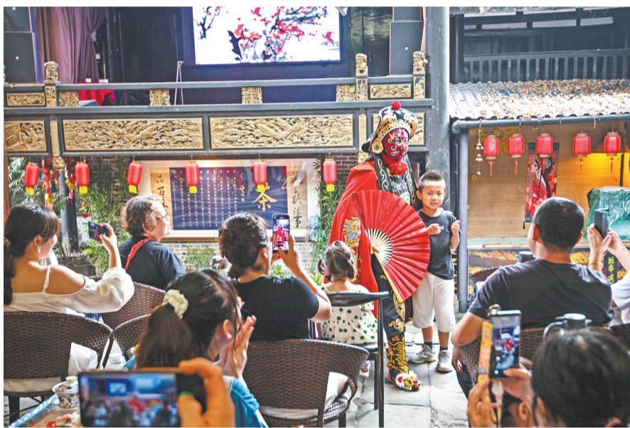
磁器口古镇宝善宫，游客们正在欣赏精彩的川剧变脸。