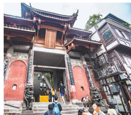
磁器口古镇宝善宫。

磁器口的第二重魅力，便是厚重历史与当代潮流的融合。熙熙攘攘的街道上，商铺的吆喝声、游客的谈笑声不断敲打着记者的耳膜。糍粑、麻花等传统小吃和奶