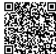
三县衙门历史文化街区精彩视频 扫一扫 就看到