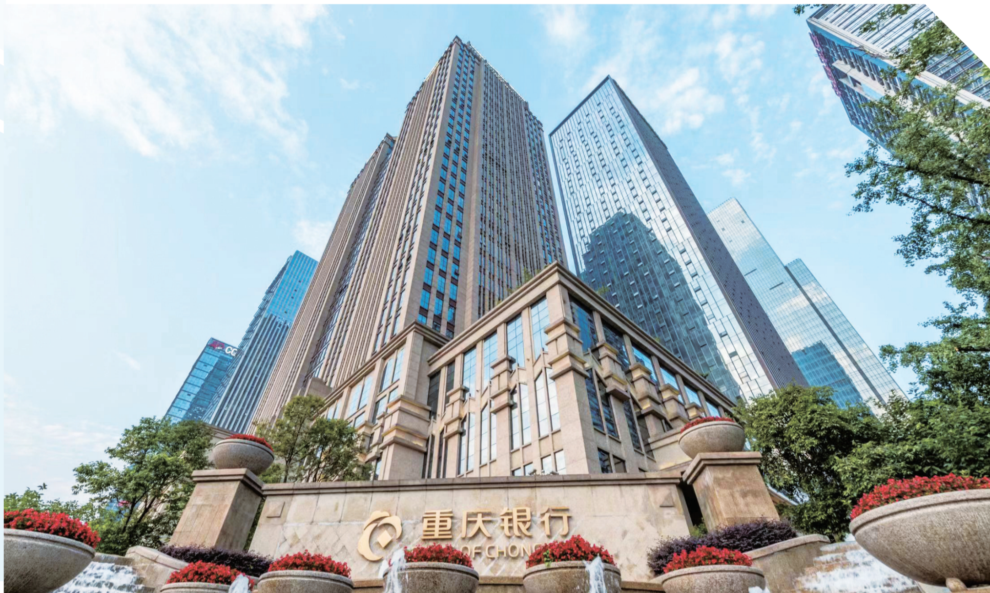
重庆银行总行大楼

阔步新征程，聚力谋发展。今年以来，重庆银行以党的二十大精神为指引，坚持稳字当头、稳中求进，开好局起好步，守正创新，踔厉奋发，在积极落实国家战略、全力服务实体经济、持续深耕普惠金融、倾情助力乡村振兴、用心办好民生实事、创新发展数字金融的过程中不断提升金融服务实力，不断为新时代新征程全面建设社会主义现代化新重庆注入强大的金融动能。