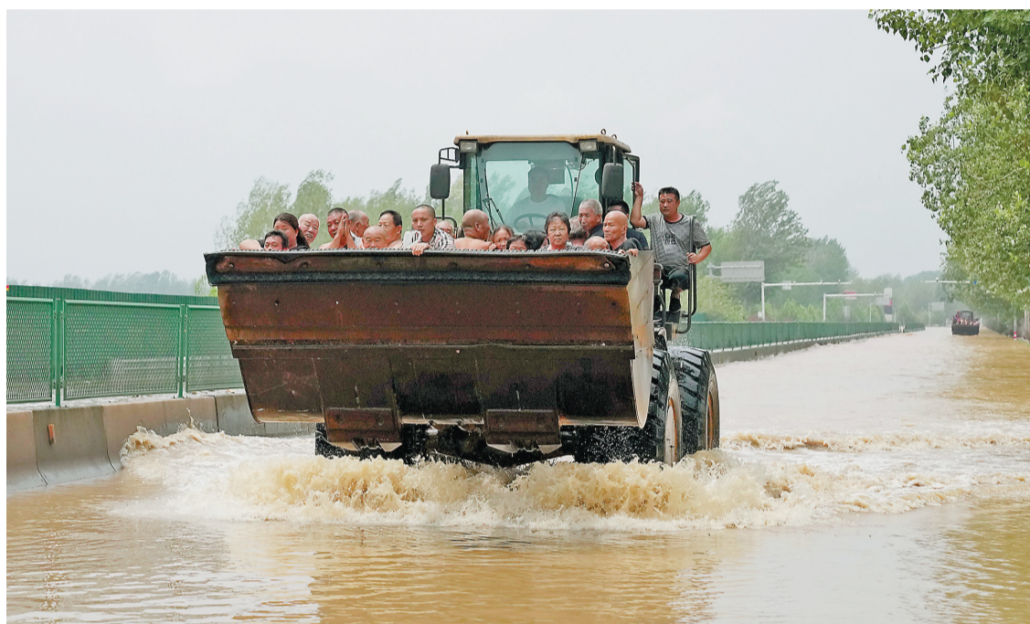
七月三十一日,在河北省邢台市宁晋县,救援人员使用工程机械设备转运北沙农村村民。