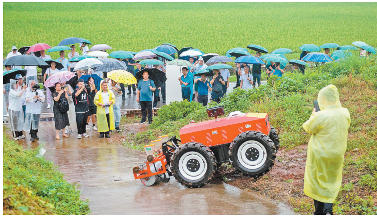
7月27日,重庆现代农业高科技园区,农科院工作人员遥控小型轮式无人驾驶农机爬上山顶农田。