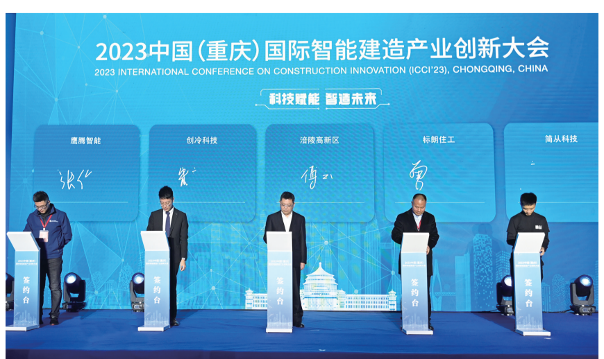
2023中国(重庆)国际智能建造产业创新大会签约现场