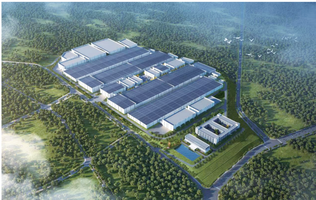
瑞浦兰钧年产30GWH电芯及PACK生产基地项目规划图

主要领导把80%以上的精力都用在招商上,全体招商人员不是在出差,就是在出差路上,不是在洽谈,就是在洽谈路上。这样紧张、高效的工作节