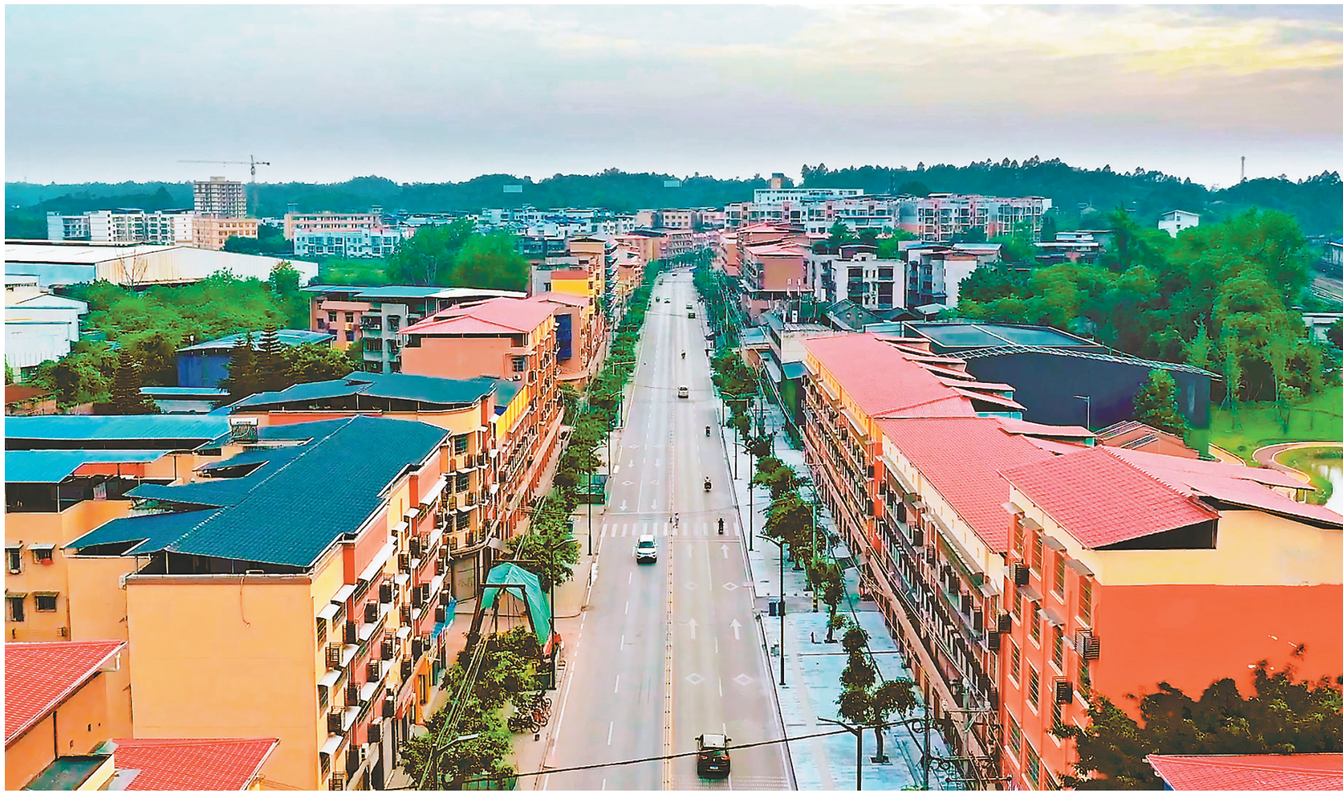
大足区邮亭镇对沿路建筑进行外墙粉刷改造后，形成极具识别性的“五彩小镇”特色。

邮亭镇以新时代守正创新的智慧与勇气，紧贴当地特色禀赋及现实需求，让群众享受新时代发展红利，在个性化城市更新、信息化促党建、大数据助推工业发展、多元化社会治理等众多领域，给出了自己的答案。