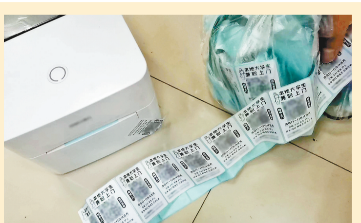
警方查获的印有不良信息的贴纸。

市民来电:沙坪坝区融汇温泉城锦绣里小区高层因二次供水问题,出现频繁停水的情况,现已影响业主日常生活,希望相关部门核实处理。(12345热线提供,截至7月17日)