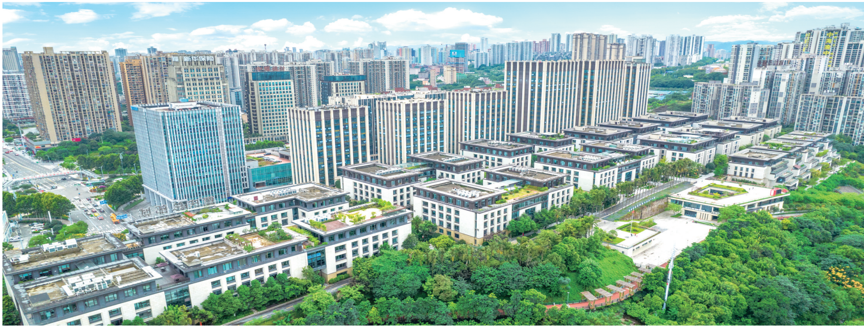
重庆市数字经济产业园