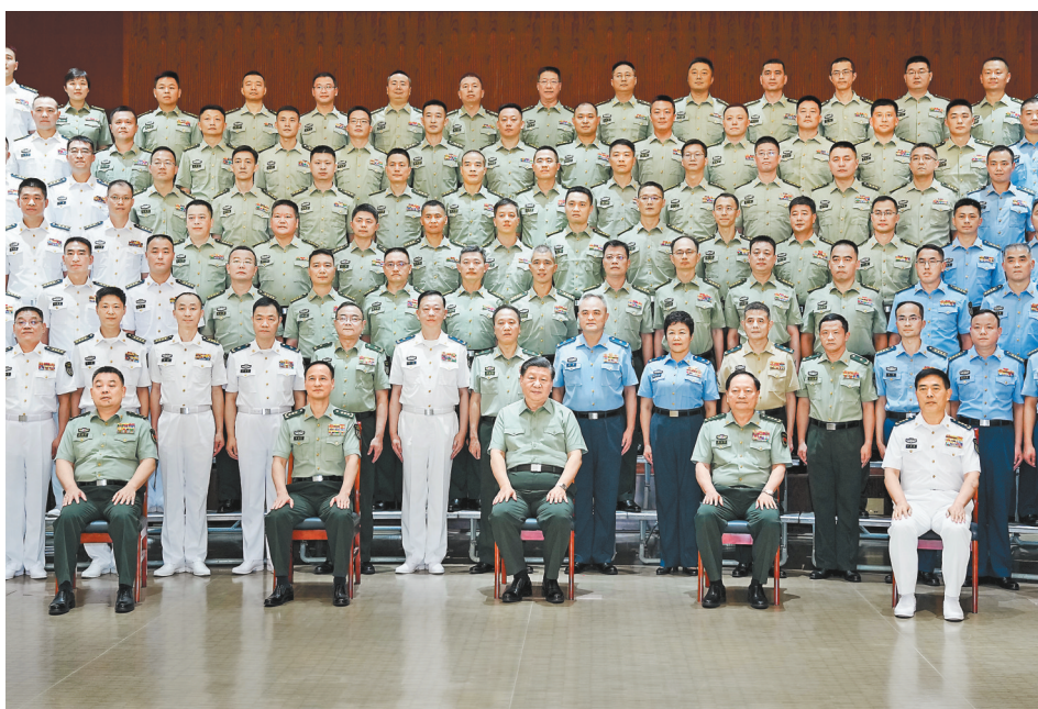
7月6日,中共中央总书记、国家主席、中央军委主席习近平视察东部战区机关,代表党中央和中央军委,向东部战区全体官兵致以诚挚问候。这是习近平亲切接见东部战区官兵代表,同大家合影留念。