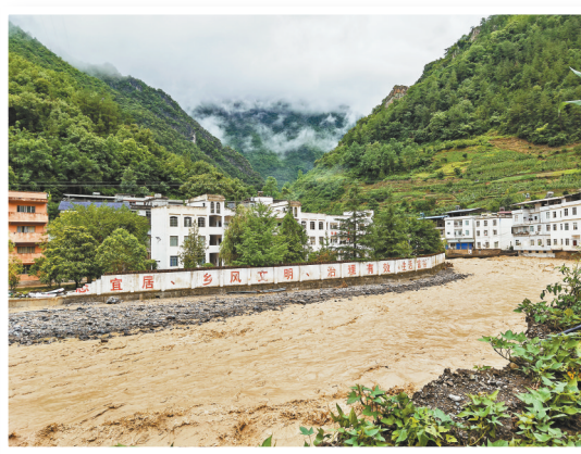
7月4日,巫山县抱龙镇抱龙河水位暴涨。