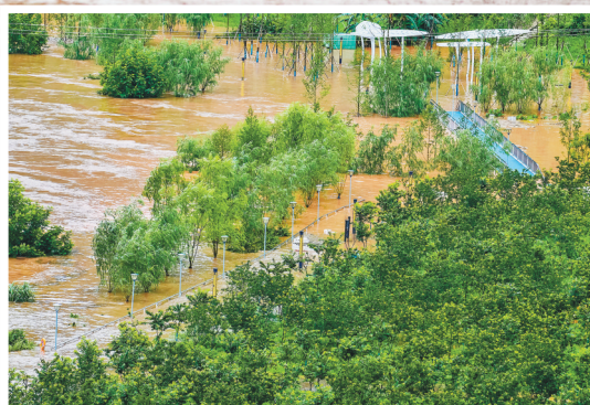
7月4日,綦江区,綦河水位不断上涨,下北街滨河步道即将被淹。

早在7月1日晚,市水利局就召开水旱灾害防御风险管控专题会议,针对已排查出的8类风险点,布置各区县全面开展再排查,对排查出的风险隐患及时采取管控措施,实施闭环管理,同时对涉水在建水利工程和已成水库进行拉网式地灾风险排查。