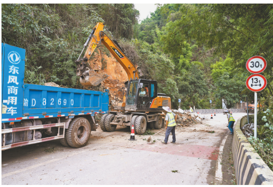
7月4日,在国道G244北碚区东阳街道路段,救援人员操作大型机械清理塌方落石。