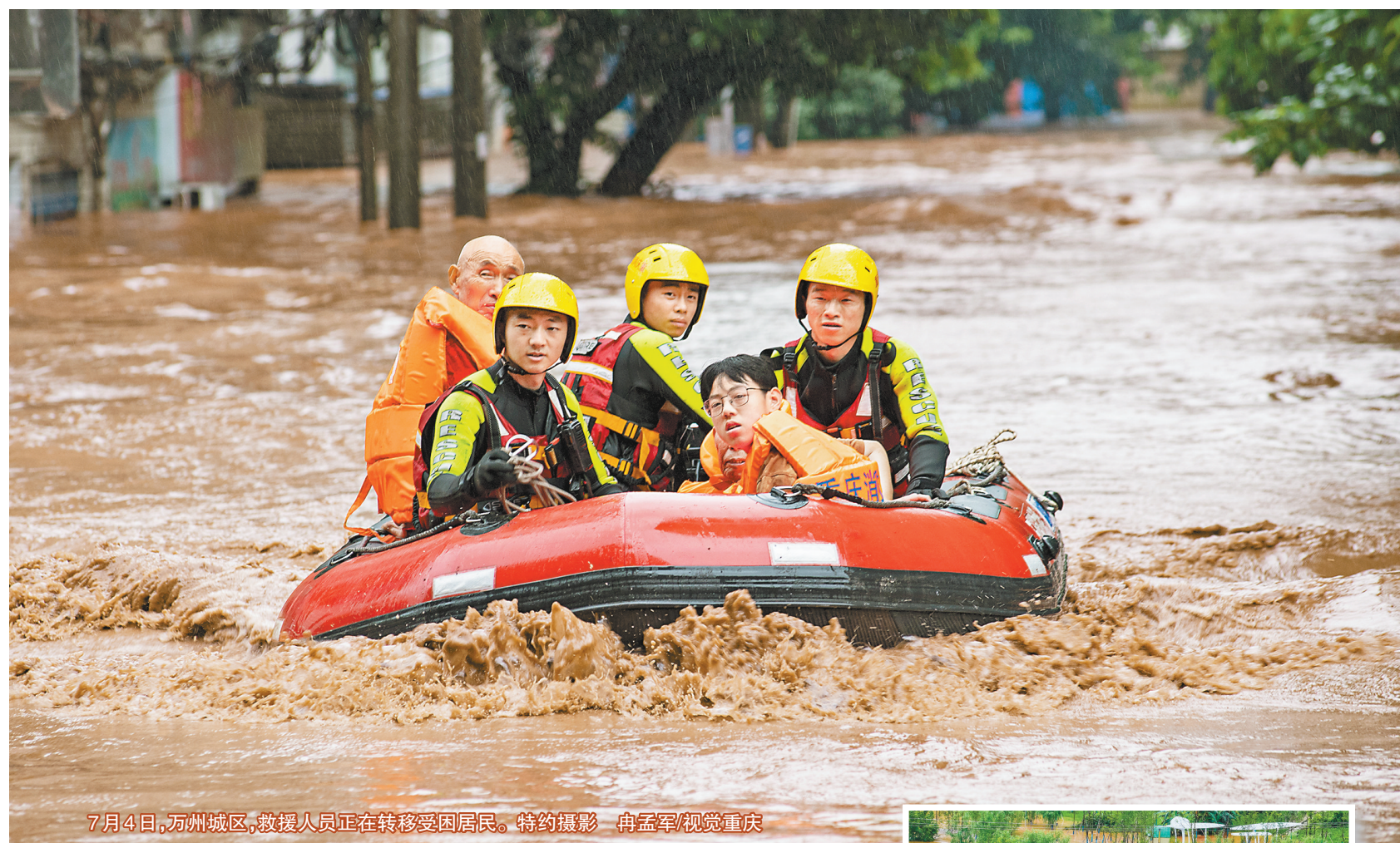
7月4日,万州城区,救援人员正在转移被困居民。