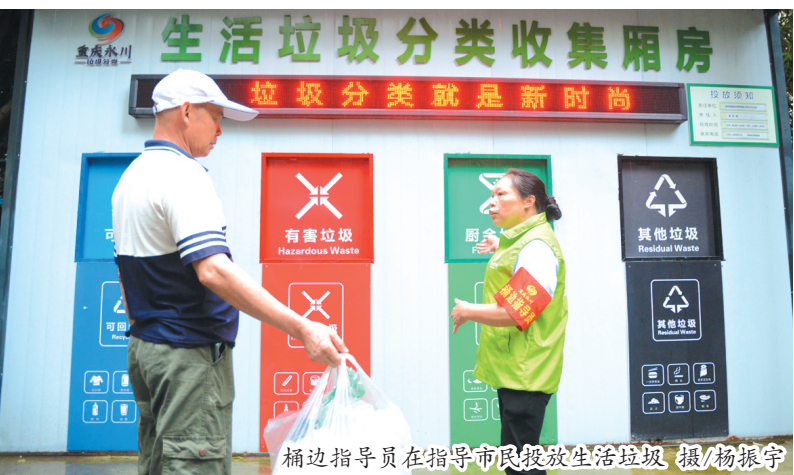
桶边指导员在指导市民投放生活垃圾。

这是永川区在收集端撤桶并点后的一个缩影。“继之前的楼层撤桶之后，我们继续在收集端做减法，现已完成撤除