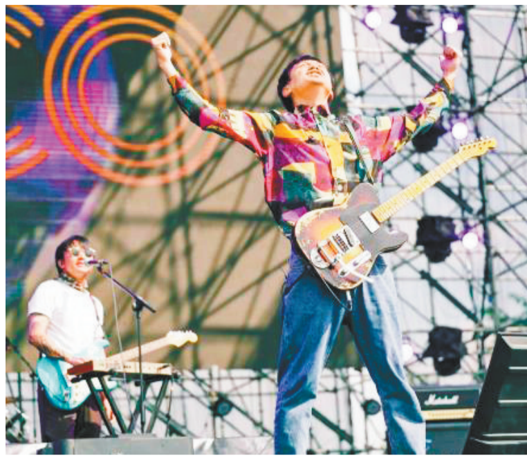
6月23日,2023“重庆乐堡 WHY NOT音乐节”在大渡口区开幕。图为音乐节现场。