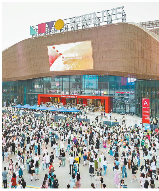
5月27日,巴南区华熙文体中心举行的王源演唱会,吸引了众多歌迷前往观看。

此外,重庆奥体中心、新建成的两江新区龙兴足球场、重庆国际博览中心等也在摩拳擦掌、跃跃欲试,不久后也将承办高品质演出,进一步丰富市民生活、繁荣重庆文艺市场。