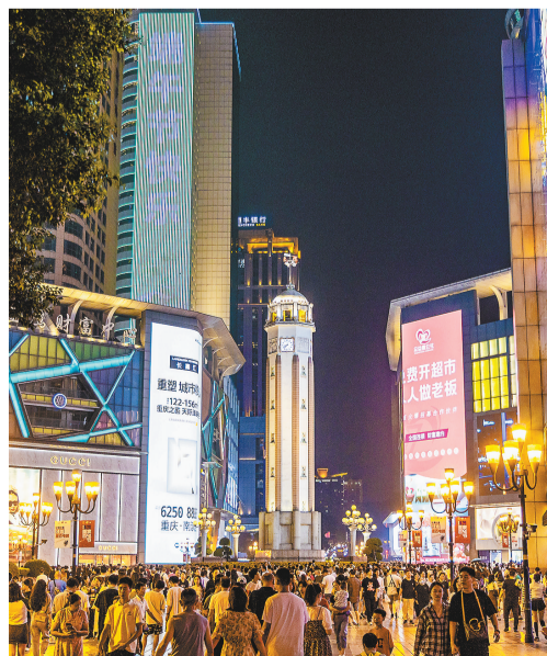
6月22日，解放碑步行街游人如织。