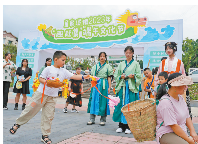
6月22日，北碚区童家溪镇文化广场，一名小男孩在参加背篓绣球体验活动。