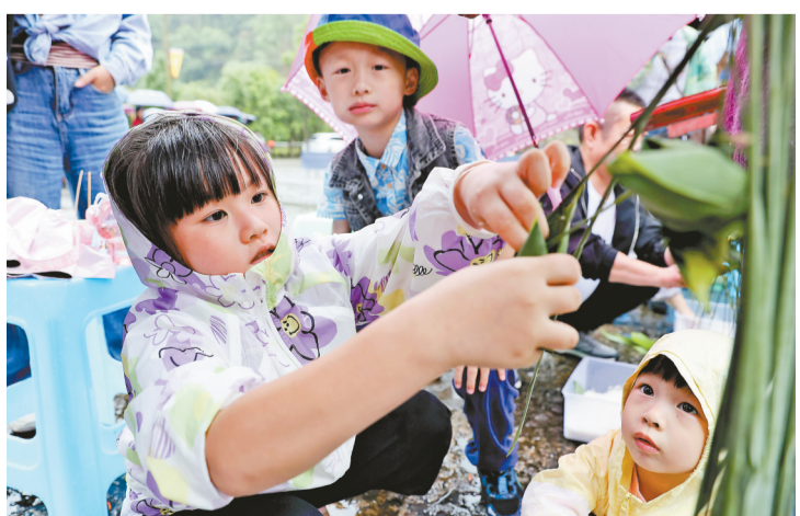
6月22日，黔江区小南海镇新建村土家十三寨，小朋友在体验包粽子。