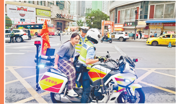
6月7日8时,重庆二十九中学,一名考生乘坐交巡警的警用摩托车到达考点。