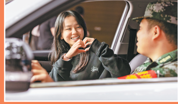
6月7日,南川中学考点,爱心送考车的志愿者在接送考生。