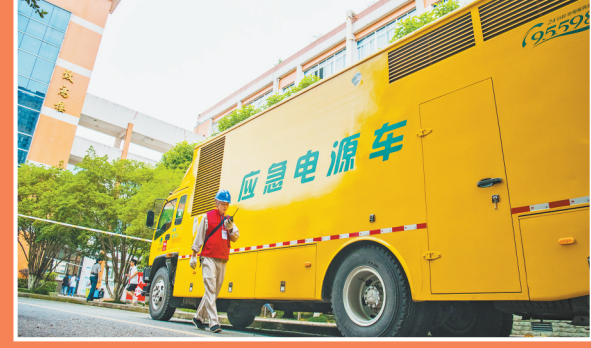
6月7日,綦江区南州中学考点,供电公司抢修人员驻点待命,确保高考供电。