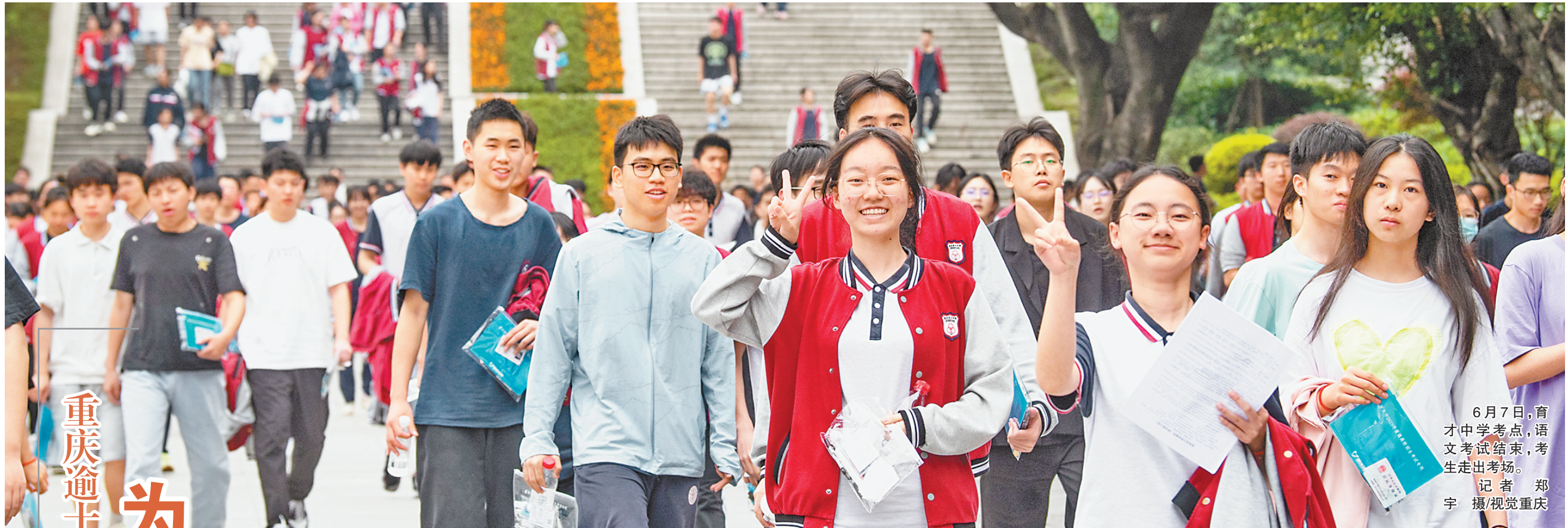
6月7日,育才中学考点,语文考试结束,考生走出考场。