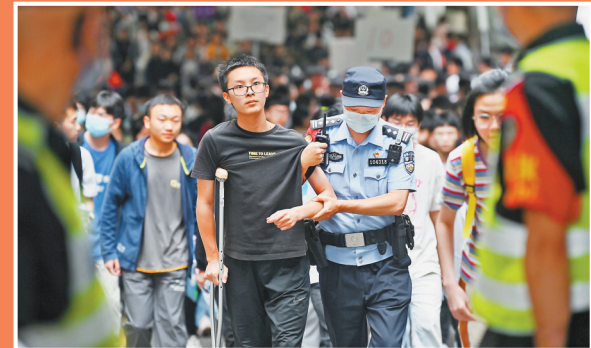
6月7日,重庆一中考点,语文考试结束后,民警护送考生出场。