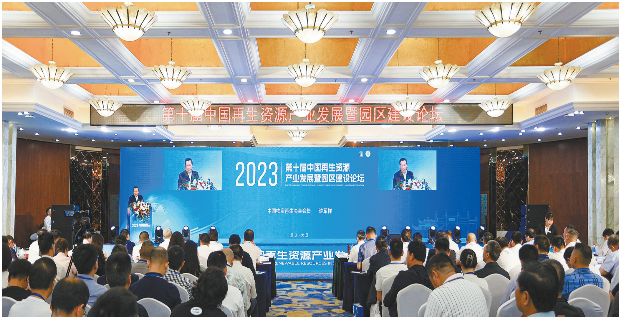
第十届中国再生资源产业发展暨园区建设论坛在大足举行

地处“成渝之心”，成渝地区双城经济圈发展主轴上的重要节点，双桥经开区作为川渝合作的桥头堡和大足区经济高质量发展发展的主阵地。近年来，双桥经开区全力落实成渝地区双城经济圈建设任务，在“绿水青山就是金山银山”理念引领下，以绿色低碳和循环发展为导向，积极践行绿色低碳循环发展理念，着力提高资源利用效率，循环经济发展实现从夯基垒台到全面发力，正向着加快打造中国西部最大的高质量循环经济产业园，创建“国家级经开区”的目标稳步迈进。