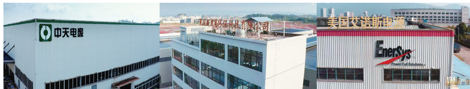
双桥经开区静脉产业企业

同时，双桥经开区推动全环节绿色发展，引导和激励企业创建绿色供应链管理，到2026年静脉产业将实现规模以上工业总产值400亿元，建成中国西部最大的高质量循环经济产业园和青少年环保教育基地。