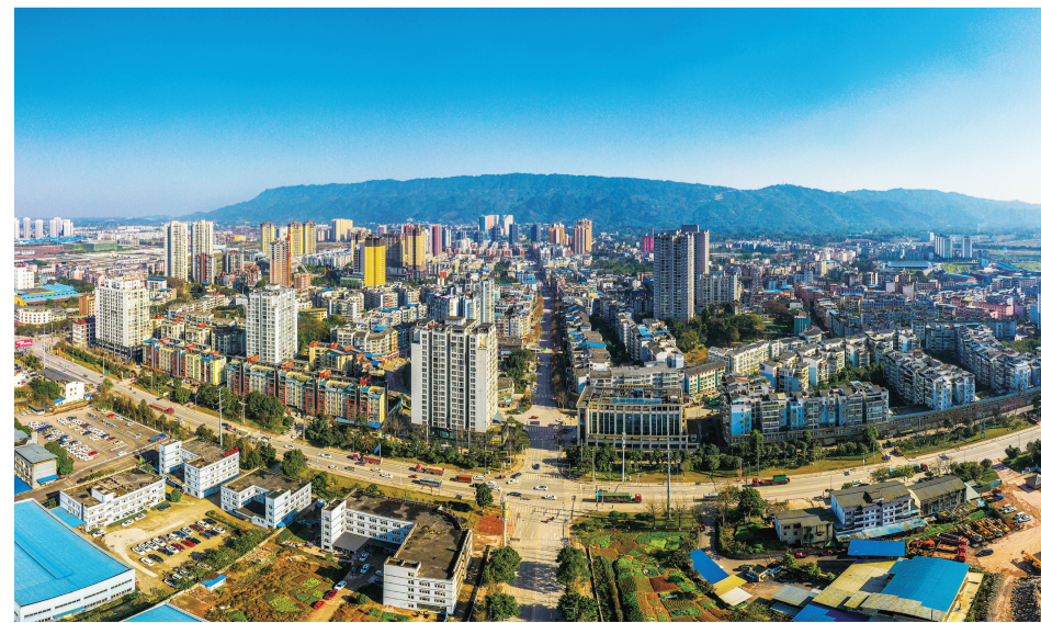
山水共生 产城景融合