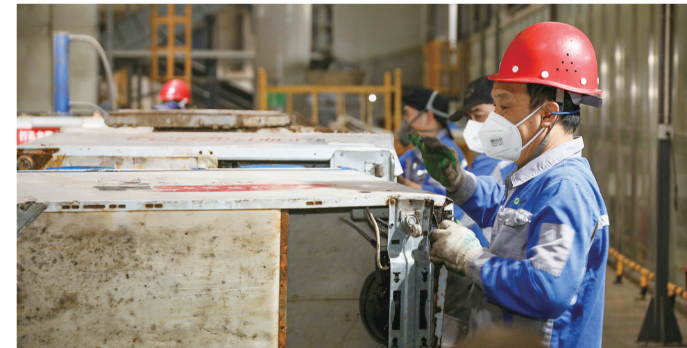
威立雅油气环境治理(重庆)有限公司工人在车间作业

通过构建循环型产业体系，双桥经开区铝、铜、废钢铁等废旧物品年交易量200万吨，2022年静脉产业实现产值超过130.3亿元，已成为全市静脉产业聚集度最高的区域。