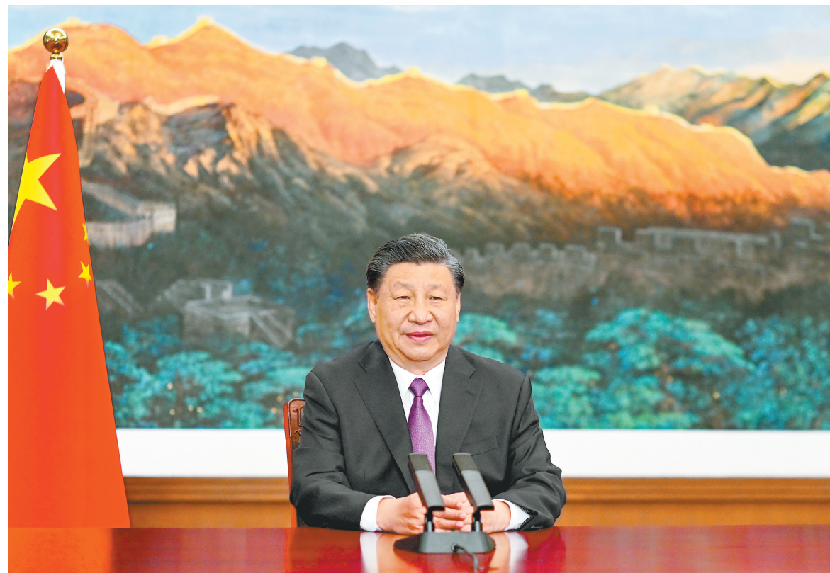
五月二十四日，国家主席习近平应邀以视频方式出席欧亚经济联盟第二届欧亚经济论坛全会开幕式并致辞。