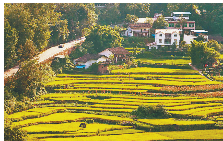
丰都县栗子乡南江村层层叠叠的梯田。

两年来，帮扶集团与当地政府的抓重点项目、激活产业“造血”功能。栗子乡规划重点项目74个，已完工43个。加快高标准农田建设，发展优质粟