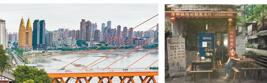
▲下浩里老街老照片。

“5月22日，南岸区下浩里老街，经过修缮建设，焕然一新的老街整体建筑及街巷肌理得到最大程度的保留。